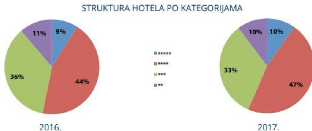
Slika 2: Struktura hotela po kategorijama za 2016. - 2017.