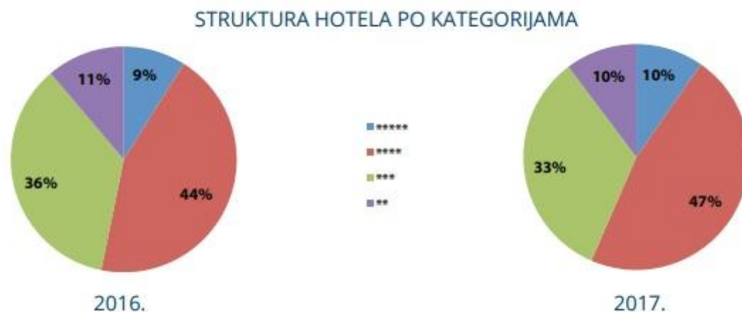
Slika 2: Struktura hotela po kategorijama za 2016. - 2017.