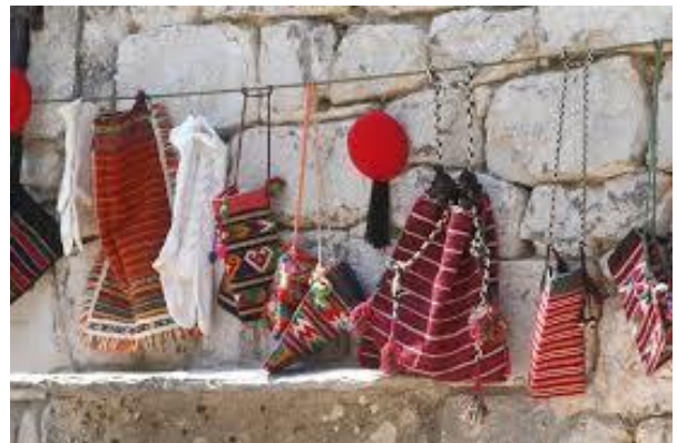
Slika 7: Tradicionalna nošnja Dalmatinske zagore

Tijekom posjete etno eko selu Škopljanci moguće se obući i fotografirati u tradicionalnoj nošnji (Slika 7) te svirati tradicionalna glazbala (gusle, diple, svirala).