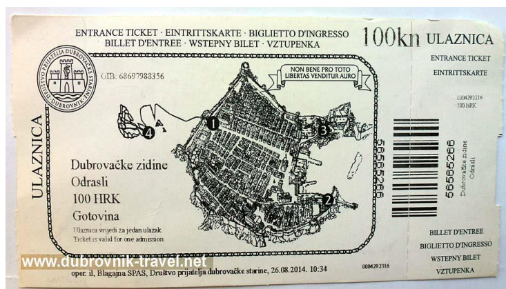
SLIKA 4: Ulaznica za gradske zidine

Okruženje u kojem se dostavlja usluga razgledavanja zidina grada Dubrovnika je jedinstveno te nijedan posjetitelj neće ostati ravnodušan. Dubrovačke zidine su savršeno mjesto za šetnju i fotografiranje te se upravo iz toga razloga ponekad stvaraju gužve jer posjetitelji nekad žele