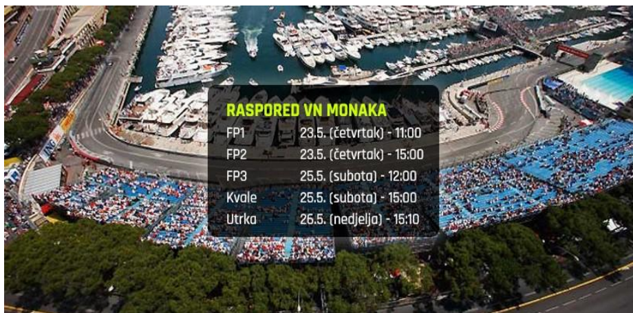
SLIKA 10: Raspored VN Monaka 2019

Ukupno trajanje cijelog događaja je 3 dana no najviše pozornosti privlači zadnji dan kad se održava i sama utrka.