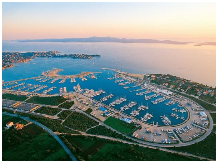
Slika 8: Marina Dalmacija Sukošan

Marina Dalmacija smještena je u Sukošanu koji se nalazi 7 km južno od Zadra, kulturnog, političkog i gospodarskog središta Sjeverne Dalmacije. Sukošan je mjesto s nešto više od 4 tisuće stanovnika te je ujedno i općina. Marina Dalmacija se proteže na 35 ha površine na kopnu, isto toliko na moru te ukupno sadrži 1400 potpuno opremljenih vezova što je čini najvećom nautičkom lukom u