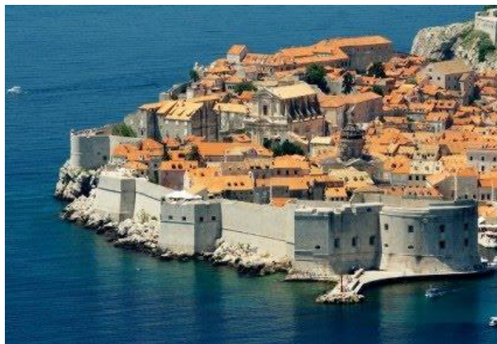
SLIKA 3: Dubrovačke gradske zidine

Razgledavanje uglavnom traje između 2 i 4 sata, naravno ovisno o tempu, često se staje zbog fotografiranja ili odmora. U 2017-oj godini prodalo se milijun i 215 tisuća ulaznica, a 2018-e godine milijun i 306 tisuća ulaznica. Zbog velikog broja posjetitelja odlučeno je da se poveća cijena ulaznica, kako bi se pokušao smanjiti broj posjetitelja, a u isto vrijeme