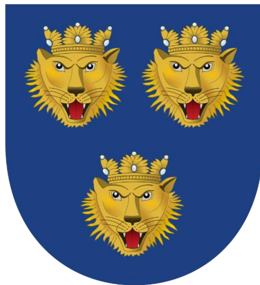
SLIKA 1: Grb Dalmacije

Prostor Dalmacije, odnosno Srednje i Južno hrvatsko primorje pokazuje stalni porast stanovništva unatoč naglašenom iseljavanju, posebice na prijelazu 19. u 20. stoljeće, i kasnije sve do danas. Međutim, to je ublažavano razmjerno visokom stopom prirodnog priraštaja, pa je održana ravnoteža rasta. Posljednjih desetljeća stopa rasta je ublažena, a u razdoblju 2001.-