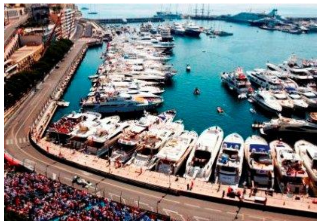
SLIKA 11: Ulice Monaka tijekom utrke „Velika nagrada Monaka“

Cijena ulaznica za utrku u Monaku variraju od 5800 eura (42 000 kn) pa sve do nešto više od 100 eura (740 kn). Razlog možemo pronaći u raznovrsnoj ponudi odnosno paketima ulaznica koje možete kupiti. Najskuplji paket uključuje pristup najluksuznijim restoranima i barovima te