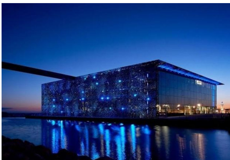
SLIKA 5: Muzej civilizacija Europe i Mediterana

MuCEM organizira razgledavanja, nudi audio-vodiče za lakše snalaženje, obiteljska razgledavanja, sadrži područja za opuštanje te restorane brze hrane. Muzej je pogodan za osobe s posebnih potrebama, također postoje slušna i vizualna pomagala koja su od velike pomoći osobama s određenim poteškoćama. Muzej sadrži određene ugostiteljske objekte koji pridonose cjelodnevnom boravku prilikom posjete muzeju uz naravno veliki broj sanitarnih čvorova.