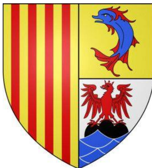
SLIKA 2: Grb regije Provansa-Alpe-Azurna obala

Klima je idealna za rast samoniklog cvijeća i aromatičnih trava brojnih vrsta - ružmarin, majčina dušica, mažuran, origano, bosiljak i lavanda. Stoga je u ovoj regiji jedna od specifičnosti upravo uzgoj cvijeća, kako za trgovinu rezanim cvijećem, tako i za proizvodnju miomirisa. 30