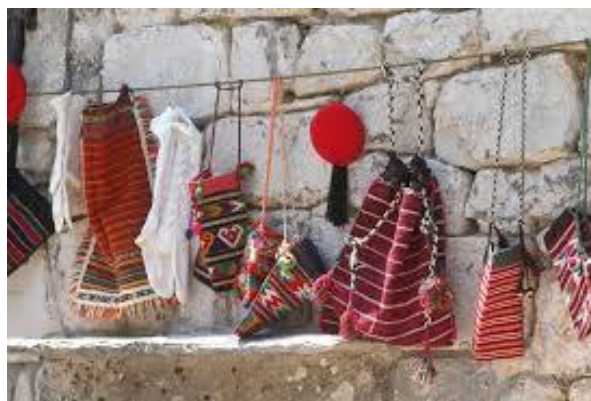
Slika 7: Tradicionalna nošnja Dalmatinske zagore

Tijekom posjete etno eko selu Škopljanci moguće se obući i fotografirati u tradicionalnoj nošnji (Slika 7) te svirati tradicionalna glazbala (gusle, diple, svirala).