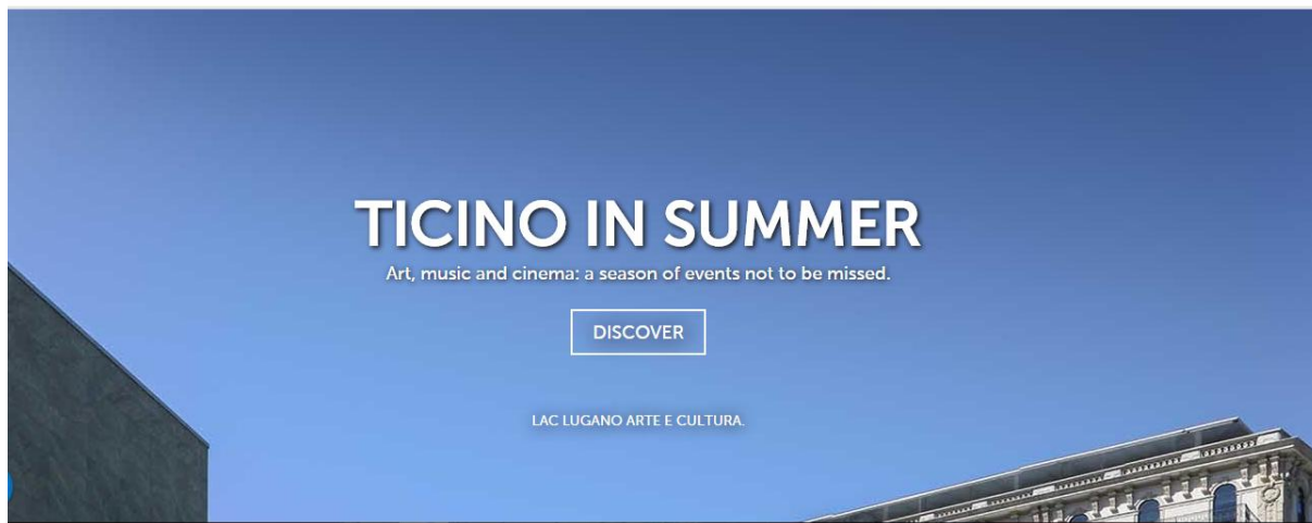
Slika 6: Početna stranica „Ticiono Tourism“