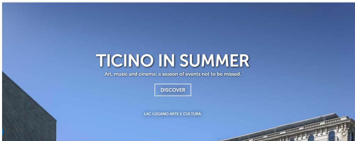
Slika 6: Početna stranica „Ticiono Tourism“