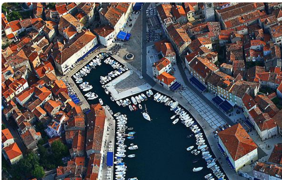
Slika 5: Prikaz luke Cres