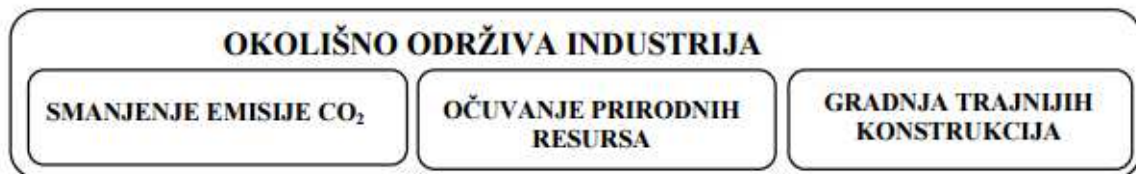
Slika 4: Prikaz okolišno održive industrije cementa.

Temelji održivosti u industriji cementa leže u tri osnovna koraka: očuvanje prirodnih resursa zamjenom dijela agregata recikliranim građevinskim otpadom i korištenjem reciklirane vode, smanjenje emisije CO 2 zamjenom dijela cementa nusproduktima drugih industrija (zgurom, letećim pepelom, silikatnom prašinom, vapnencem) te projektiranje, gradnja i održavanje trajnijih betonskih konstrukcija.