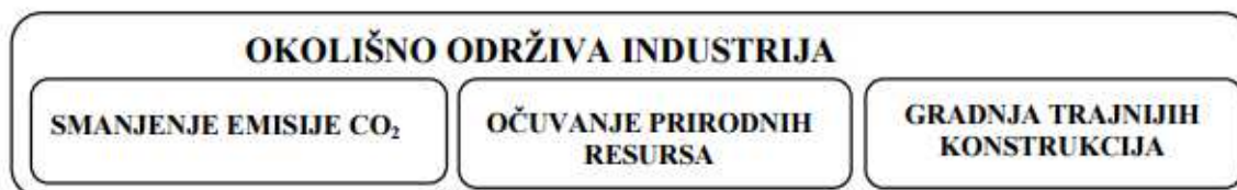
Slika 4: Prikaz okolišno održive industrije cementa.

Temelji održivosti u industriji cementa leže u tri osnovna koraka: očuvanje prirodnih resursa zamjenom dijela agregata recikliranim građevinskim otpadom i korištenjem reciklirane vode, smanjenje emisije CO 2 zamjenom dijela cementa nusproduktima drugih industrija (zgurom, letećim pepelom, silikatnom prašinom, vapnencem) te projektiranje, gradnja i održavanje trajnijih betonskih konstrukcija.