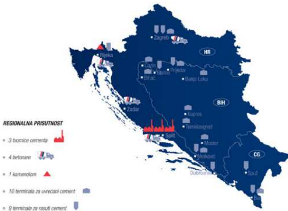
Slika br. 3: Prikaz lokacija Cemex-a u regiji.

Nakon tih događanja došlo je do promjene poslovanja i u posljednjoj tvornici gdje je provedena sistematizacija tvornice te je restrukturiran plan rada. Od nekadašnjih 1900 zaposlenika Dalmacijacementa danas Cemex zapošljava oko 600 radnika ali što se tiče regije, drži polovicu tržišta. Smanjen broj radnika je iz razloga sistematizacije rada, dok je Dalmacija cement uslijed lošeg poslovanja prije preuzimanja Cemex-a imala veliki broj radnika, dolaskom Cemexa zaustavljen je negativan trend te se polako proizvodnja širi što direktno traži veći broj radnika.