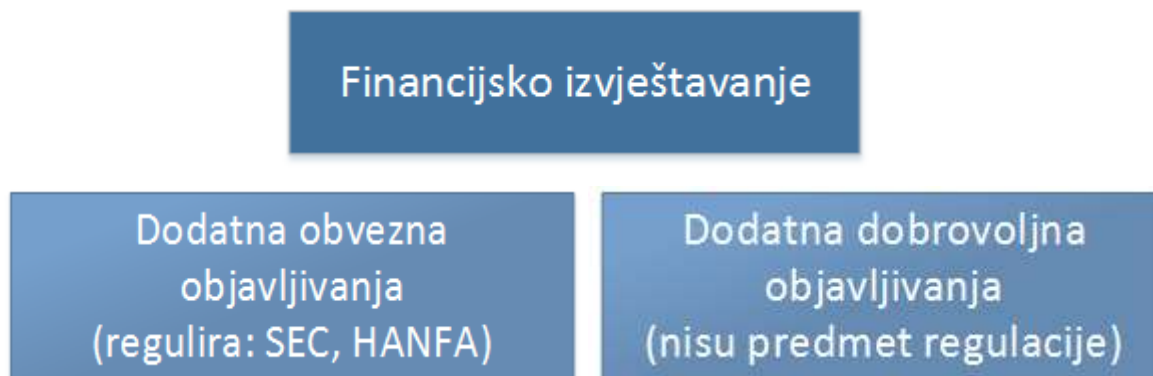
Slika 1: Struktura financijskog izvještavanja

mjerenje i evidentiranje ekonomskih aktivnosti gospodarskog subjekta dok financijsko izvještavanje označuje komuniciranje takvih informacija prema vanjskim korisnicima. 44