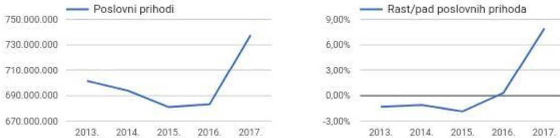
Slika 9. Poslovni prihodi Heineken Hrvatska