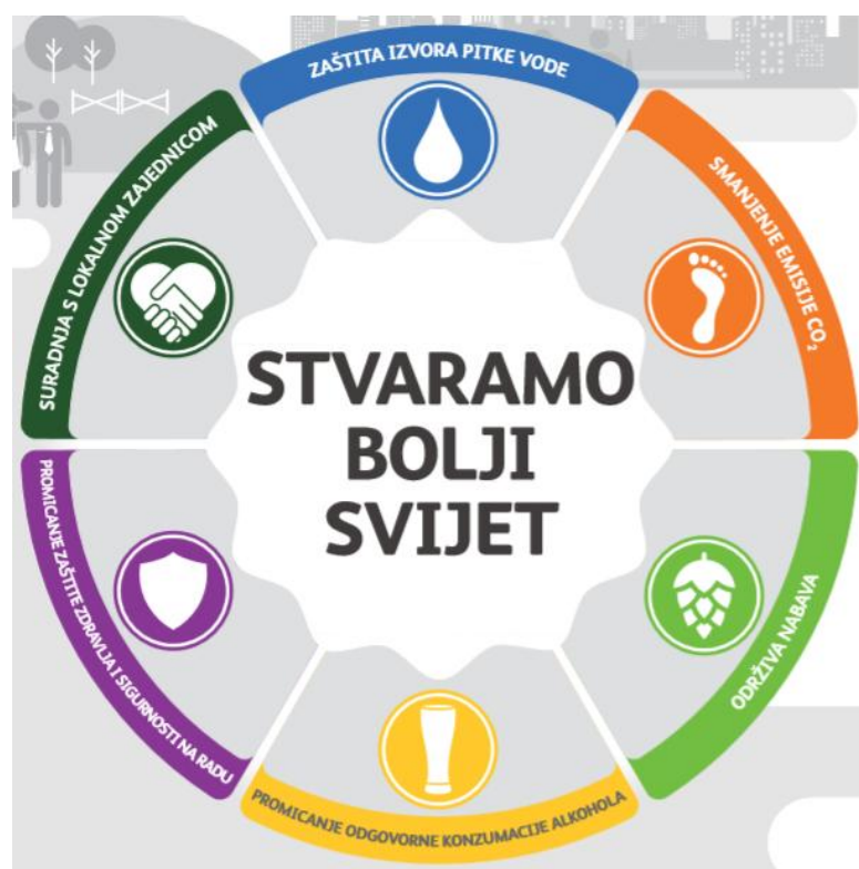
Slika 5. Ključne vrijednosti Heineken Hrvatska