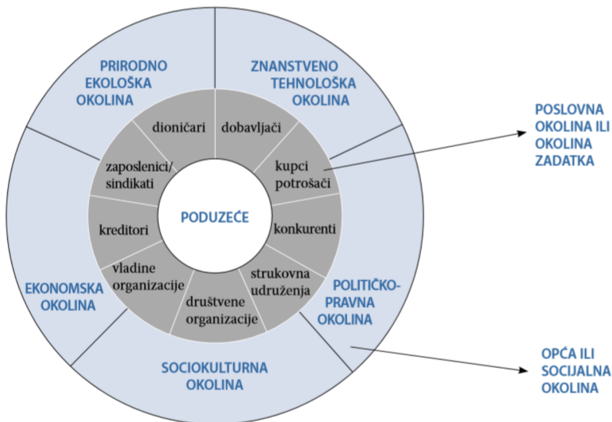
Slika 2. Dijelovi eksterne okoline poduzeća