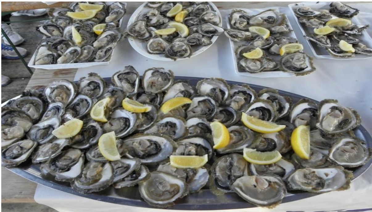
Slika 1: Stonske kamenice

Restoran Bota Šare se nalazi na samoj rivi u Malom Stonu u srednjovjekovnom skladištu soli. Sam naziv Bota označava staro dubrovački naziv za lukovima nadsvođen strop. Restoran nudi i njeguje izvornu autohtonu dalmatinsku kuhinju, a inspiraciju za svoja jela vuče iz dvije stare kuharice pronađene u prašnjavim kutcima ovog monumentalnog zdanja. Kamenica kao zaštitni proizvod ovog kraja, a zatim i sve ostale školjke, rakovi i ribe spremljeni po originalnim stonskim receptima iz još iz vremena Dubrovačke Republike. 25