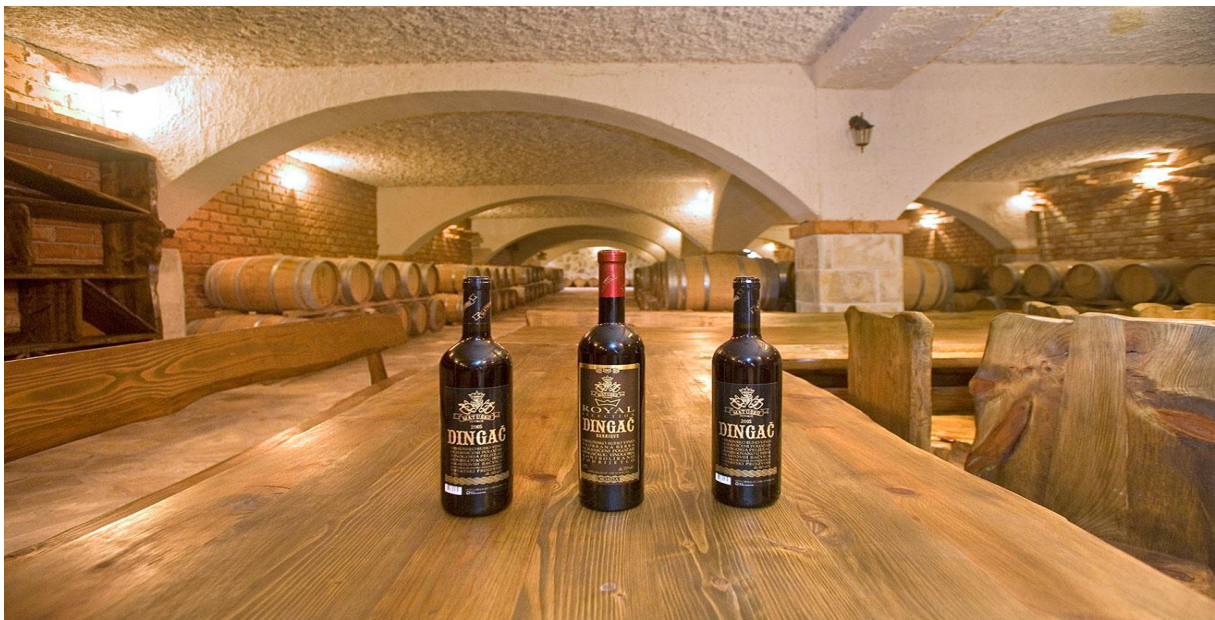
Slika 2: Vinarija Matuško

Vinarija „Saint Hills“ se nalazi u malom selu zvanom Oskorušno. U vinogradu sv. Lucie uzgajaju autohtonu sortu Plavca malog, već spomenuti Dingač. U svojoj vinariji osim što nude kušanje vina, poslužuju i autohtone specijalitete pelješkoga kraja.