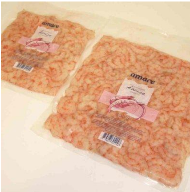
Slika 9. Meso od kozica

Izvor: http://centaurus.hr/proizvodi/slana-marinirana-dimljena-riba/ (12.6.2019.)