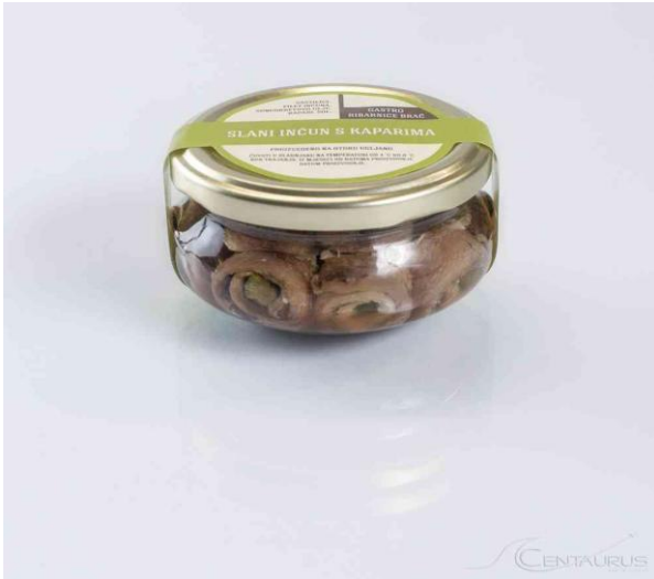
Slika 6. Slani inćuni s kaparima