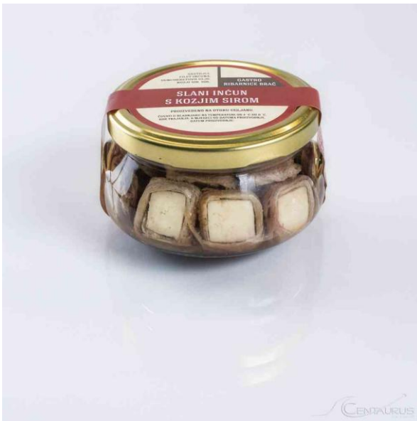
Slika 7. Slani inćuni s kozjim sirom