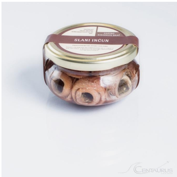
Slika 4. Slani inćuni