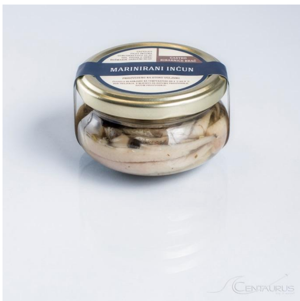
Slika 5. Marinirani inćuni