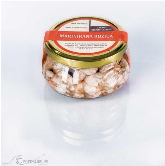
Slika 8. Marinirane kozice