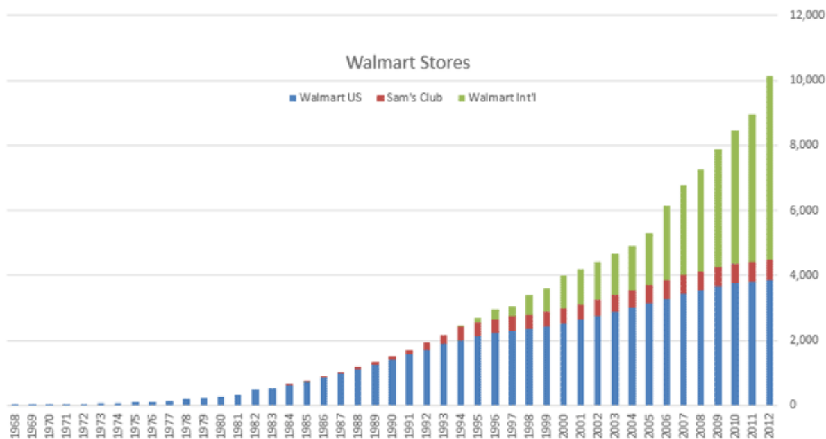
Slika 3: Porast broja Walmart trgovina u razdoblju od 1968. do 2012.