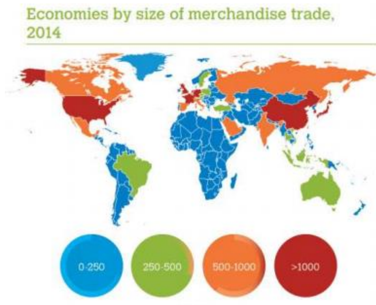
Slika 1: Ekonomija prema veličini robne razmjene 2014. (u američkim dolarima)

Današnje gospodarstvo razvija se iz tri žarišta: Zapadne Europe, SAD-a i Istočne Azije (Kina, Japan). Takav razvoj gospodarstva možemo nazvati trijadizacijom. Međuovisnost te tri jezgre vrlo je jaka. Ostatak svijeta se ugleda na najbliže dominantne polove i pokušava prilagoditi svoje vlastito gospodarstvo njihovom. Preuzimajući njihova znanja i tehnologije prilagođujući ih lokalnim prilikama, zemlje u razvoju mogu brzo napredovati. Problem je, međutim, što bez kvalificiranih inženjera, znanstvenika i poduzetnika nema ni napretka. Potrebno im je daljnje ulaganje u obrazovanje i zadržavanje već kvalificiranih stručnjaka koji će ponijeti napredak svojih zemalja. 10