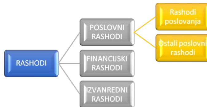
Slika 2: Vrste rashoda prema ZOR-u