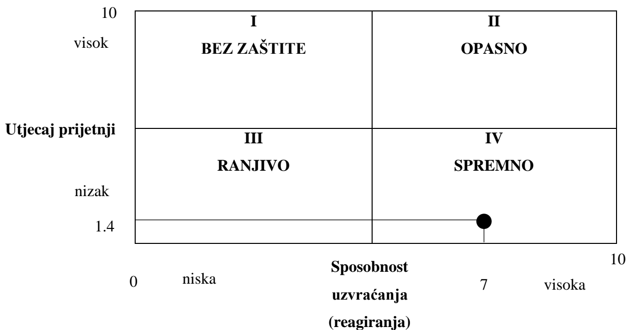
Slika 2: Matrični prikaz analize i procjene ranjivosti poduzeća Dalekovod d.d.