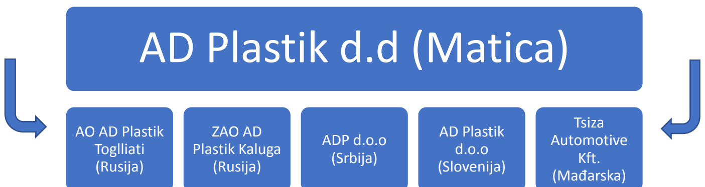
Slika 4. Organizacijska struktura