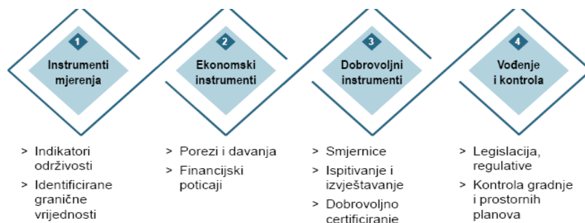
Slika 1. Instrumenti za implementaciju održivog razvoja turizma