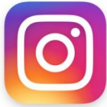
Slika 4. Ikona Instagram-a