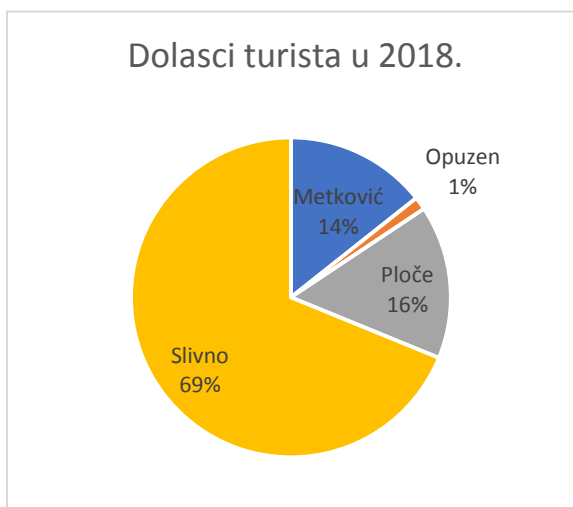
Slika 1: Struktura dolazaka po TZ u 2018.