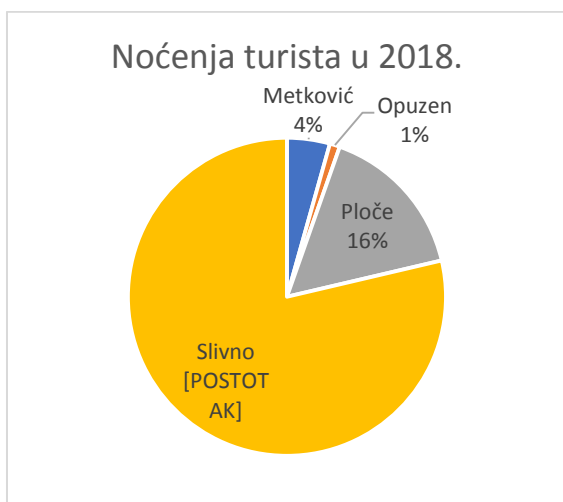
Slika 2: Struktura noćenja po TZ u 2018.

Slika 2 daje uvid u strukturu noćenja po turističkim zajednicama na području neretvanske doline u 2018. godini. Općina Slivno ponovo ima najveći udio (veći čak i od udjela u dolascima), a on iznosi 79%. Grad Ploče ostvario je 16% noćenja, jednako kao i dolazaka, dok grad Metković sudjeluje s dosta manje noćenja nego dolazaka, tek 4%. Noćenja u Opuzenu čine udio od 1% što je jednako kao i kod dolazaka.