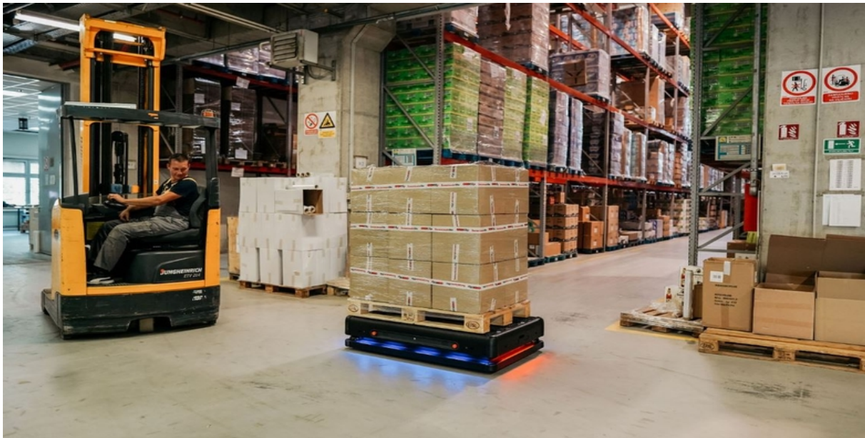
Slika 6: Robot Gideon Brothersa u distribucijskom centru Orbica u Ivanić-Gradu

Upravo u distribucijskom centru u Ivanić-Gradu, Orbico je pokrenuo pilot projekt uvođenja autonomnih mobilnih robota Gideon Brothersa. 38