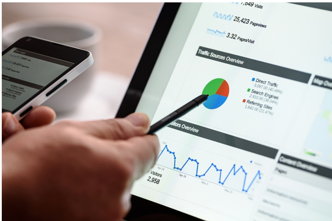
Slika 3: Istraživanje tržišta

U poduzeću se mora izgraditi marketinški informacijski sustav koji će prikupljati, analizirati, memorirati i distribuirati neophodne informacije. Kada se to ispuni, doći će do povećanja učinkovitosti prodajnih odluka te unaprjeđenja procesa planiranja, izvršenja i kontrole prodajnih aktivnosti. Ciljno tržište je skupina kupaca koji žele ili trebaju odgovarajuće proizvode ili usluge.