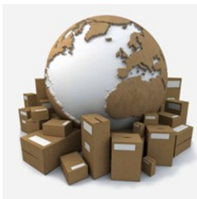
Slika 1: Distribucija

U tom smislu protoka robe pojam distribucije pojavio se kada je porastao interes za trgovinske troškove 1930-ih godina. Tada je u velikom broju zemalja započeo niz istraživanja, monografija i teorijskih analiza iz područja unutarnje trgovine. Nastavno na navedeno, iskustva Njemačke i SAD-a utjecala su na Međunarodnu trgovinsku komoru da potakne trgovinska istraživanja u 23 zemlje svijeta i da 1932. osnuje specijalizirani Biro za studije distribucije.