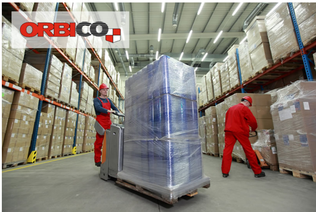
Slika 5: Distribucija u poduzeću Orbico d.o.o.