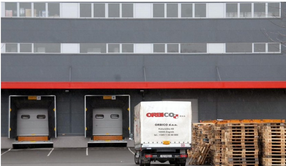
Slika 9: Orbico dostavni kamion