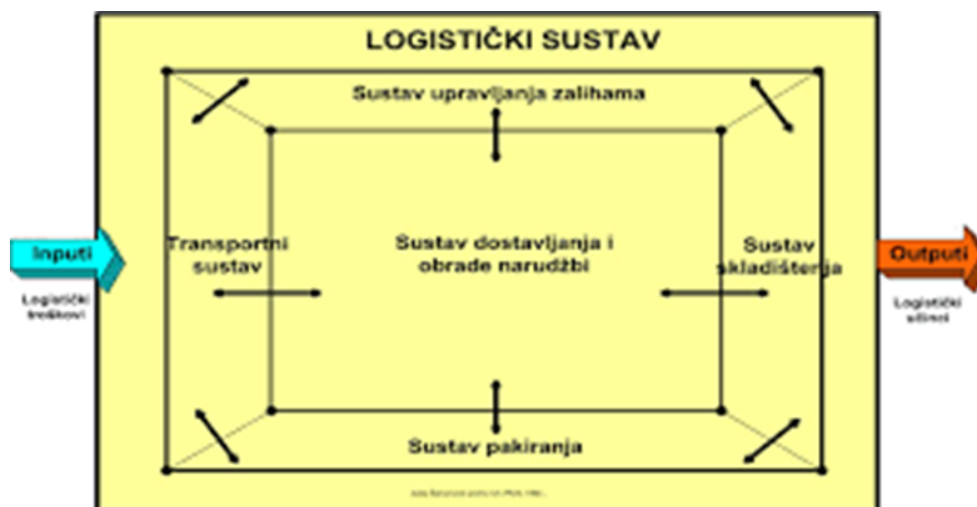
Slika 2: Logistički sustav