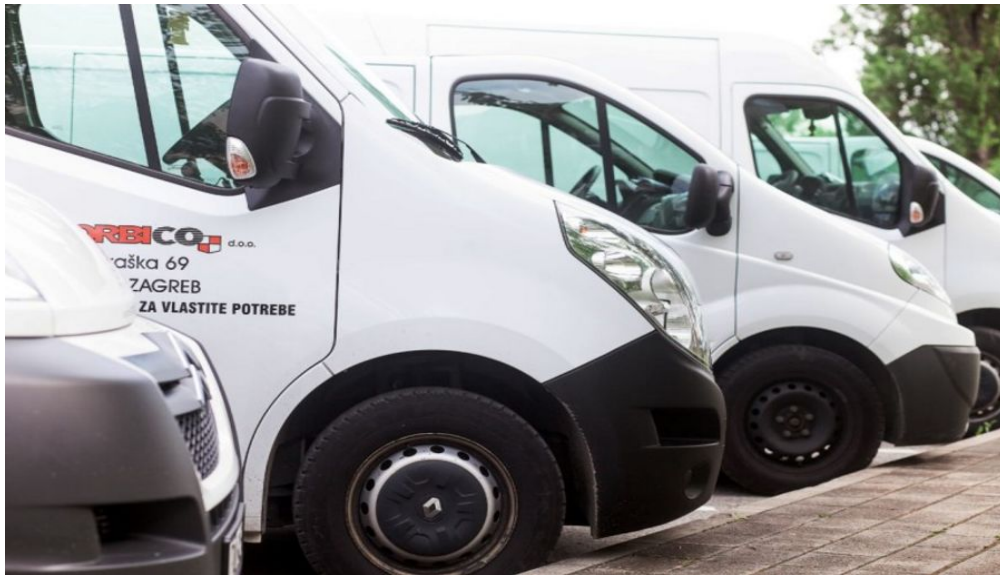
Slika 8: Orbico kombi

Izvor: https://www.european-business.com/portraits/orbico-doo/from-the-baltic-to-the-black-sea