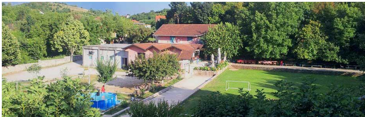
Slika 3.: Obiteljsko domaćinstvo Mustang, dostupno na: www.visitsinj.hr