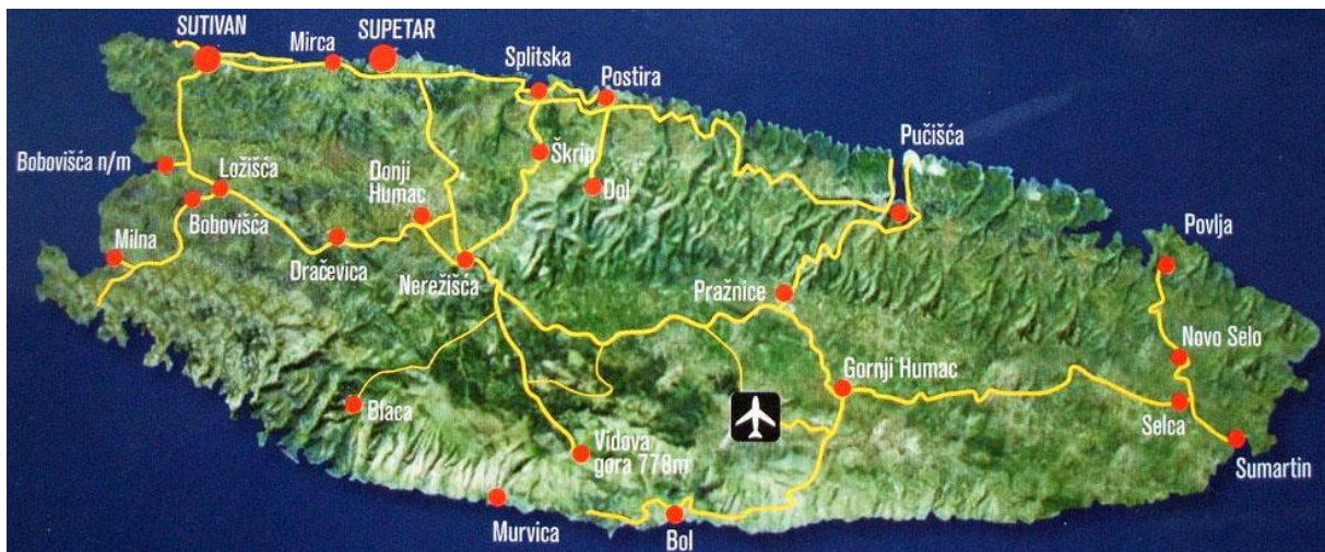
Slika 2: Karta otoka Brač

Otok Brač administrativno je podijeljen na grad Supetar i općine: Selca, Milna, Pučišća, Sutivan, Nerežišća i Bol. Svaka općina ima vlastitu lokalnu turističku zajednicu s vijećem i proračunom.