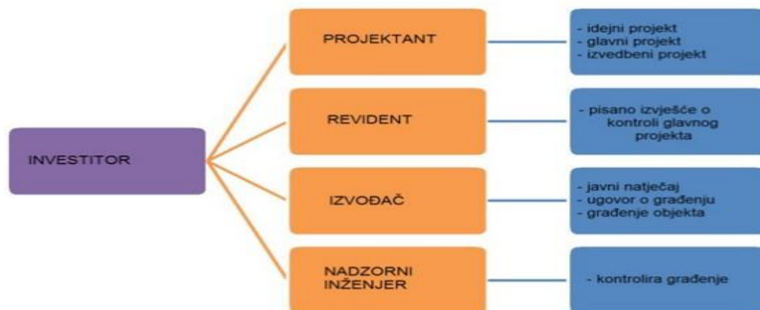
Slika 3 : Sudionici u izgradnji objekta