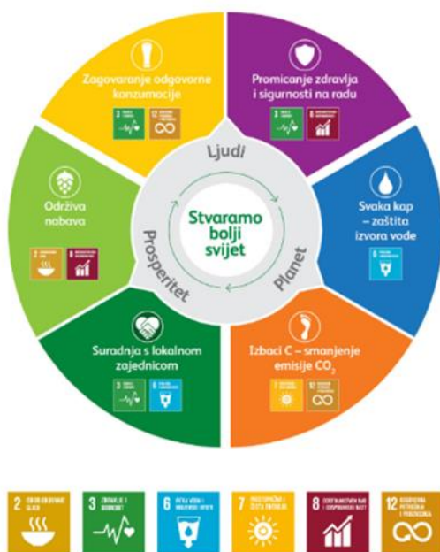
Slika 6: Heineken Hrvatska - strategija Stvaramo bolji svijet