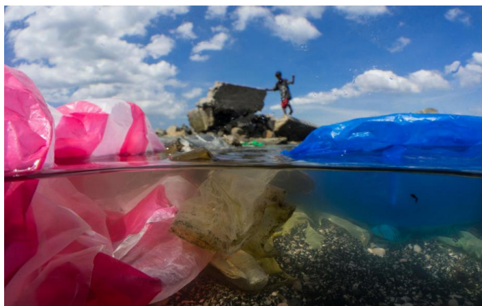
Slika 5: More zagadeno plastikom

Održiva potrošnja i proizvodnja se odnose na promicanje efikasnog korištenja resursa gdje se ima za cilj „s manje raditi više i kvalitetnije“. Također se odnose na održivu infrastrukturu i stvaranje pristupa osnovnim uslugama za sve, stvaranje radnih mjesta koji će naposljetku stvoriti bolje uvjete za kvalitetniji način života. Brojni su akteri koji trebaju sudjelovati kako bi se došlo do odgovorne tj. održive potrošnje i proizvodnje. 34 Važno je djelovanje na svim frontama: usvajanje održivih praksi i izvješćivanje o održivosti poduzeća, promicanje održivih praksi javnih nabava i racionalizacija neučinkovitih subvencija na fosilna goriva od strane kreatora politika, ekološki svjestan životni stil potrošača, razvoj novih tehnologija, metoda proizvodnje i potrošnje od strane istraživača i znanstvenika i drugih. Ovim se ciljem predviđa održiva potrošnja i proizvodnja koja koristi resurse učinkovito, smanjuje globalni prehrambeni i drugi otpad te odlaže sigurno toksični otpad. 35