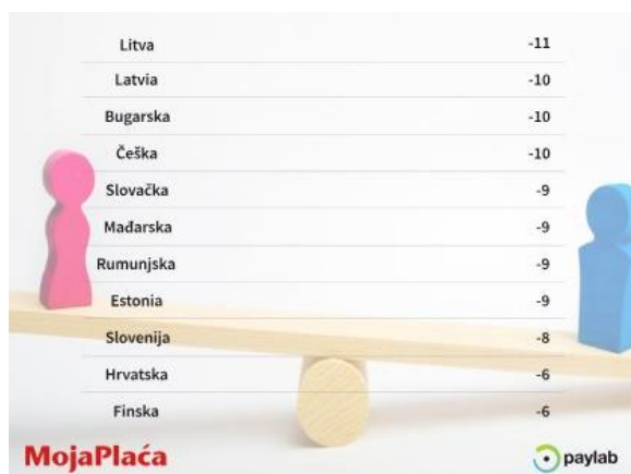
Slika 3: Razlika u prosječnim plaćama muškaraca i žena za isto radno mjesto (%)

Razlika u plaći između rodova najviše dolazi do izražaja upravo na istom položaju zbog toga što je tada najlakše uspoređivati. Rad se temelji na istom opterećenju s istim preduvjetima za određeno radno mjesto kao što su prethodno radno iskustvo, stečene vještine te obrazovanje. 18