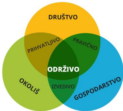
Slika 1: Ravnoteža između tri elementa održivog razvoja