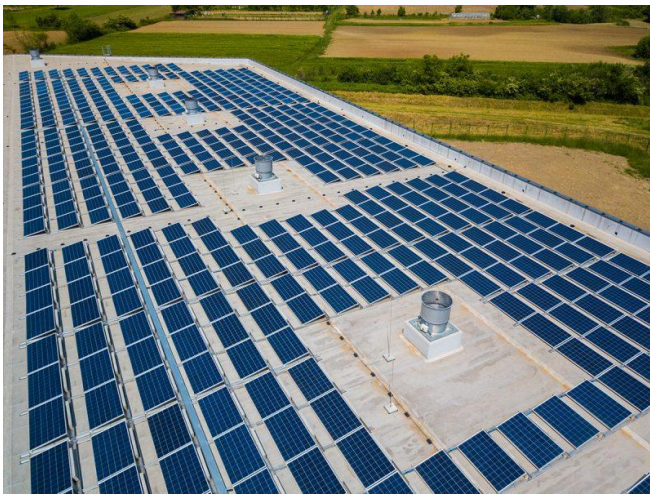
Slika 7.: Solarni paneli, Heineken Hrvatska

Pivovara izrazito brine o sigurnosti i zdravlju svojih zaposlenika. U dvije i pol godine nije zabilježena niti jedna nesreća u krugu pivovare. Također, pivovara nastoji educirati mlade i roditelje o opasnosti maloljetničke konzumacije alkohola. Upravo o tome su u suradnji s psihološkim centrom i policijskom upravom grada Karlovca educirali 400 roditelja i 850 tinejdžera. Osim toga, u suradnji s Kakvartom nastoji poboljšati kvalitetu života te ulaže u društvene i zelene projekte. U zadnjih 10 godina, zbog tehnoloških unapređenja pivovara je smanjila potrošnju vode u proizvodnji za 43%, a emisiju CO 2 za čak 67%. 52