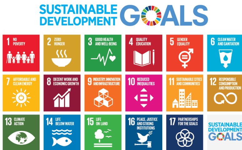
Slika 2: Agenda 2030. – ciljevi održivog razvoja

Ciljevi su vezani uz same elemente održivog razvoja tj. svaki cilj može se razvrstati u jednu od kategorija: gospodarski, društveni, okolišni. Sedamnaest je ciljeva koji se žele postići, a obuhvaćaju široki spektar gospodarskih, društvenih i okolišnih aspekata. Primjenjivi su u svim državama, uzajamno su povezani te zahtijevaju preuzimanje odgovornosti. Kako bi se stvorio svijet dostojan kvalitetnog življenja potrebno je da svaki od ciljeva bude u fokusu svake tvrtke i sektora. Kada se povezuje lokalno i globalno te se poslovanje usklađuje prema ciljevima održivosti tvrtka može doći do novih poslovnih prilika u budućnosti, jačati odnose s partnerima te dovesti do stabilizacije društva.