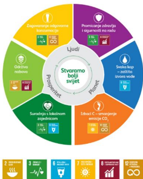
Slika 6: Heineken Hrvatska - strategija Stvaramo bolji svijet

Izvor: Službena stranica Heineken Hrvatska, https://heineken.hr/sustainability