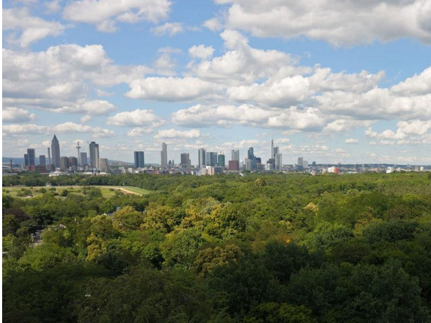
Slika 8: Stadtwald, Frankfurt

(od ukupno 5 785) nalazi se unutar gradskih granica. Polovica gradskog područja sastoji se od prirodnih krajolika, a oko 80% stanovništva živi unutar 300 metara javnog zelenog prostora. 53