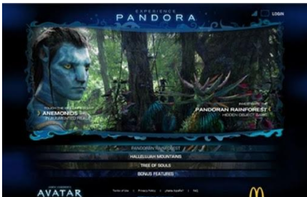
Slika 4. Virtualne tehnike na primjeru kampanje McDonald's i filma Avatar

koje okružuje i privlači osobu snažnim, realističnim slikama i zvukovima. 50 Takva kampanja bila je integrirana kroz virtualne igrice, igračke kupnjom „Happy Meal“, TV reklama itd. „Marketing za ovakva područja integrira sadržaj i oglašavanje toliko neprimjetno da je teško razlikovati jedno od drugog.“ 51 (Slika 4.)