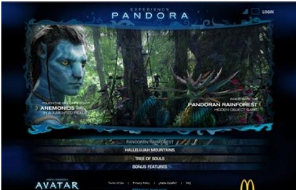
Slika 4. Virtualne tehnike na primjeru kampanje McDonald's i filma Avatar

koje okružuje i privlači osobu snažnim, realističnim slikama i zvukovima. 50 Takva kampanja bila je integrirana kroz virtualne igrice, igračke kupnjom „Happy Meal“, TV reklama itd. „Marketing za ovakva područja integrira sadržaj i oglašavanje toliko neprimjetno da je teško razlikovati jedno od drugog.“ 51 (Slika 4.)