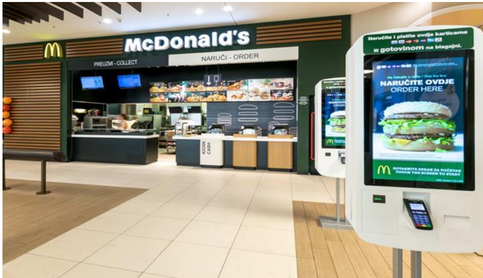
Slika 6. Primjer interijera McDonald's restorana

Izvor: https://mcdonalds.hr/o-nama/mcdonalds-buducnosti/ (Datum pristupa: 16.08.2020.)