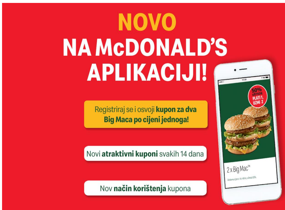
Slika 2. McDonald's kuponi