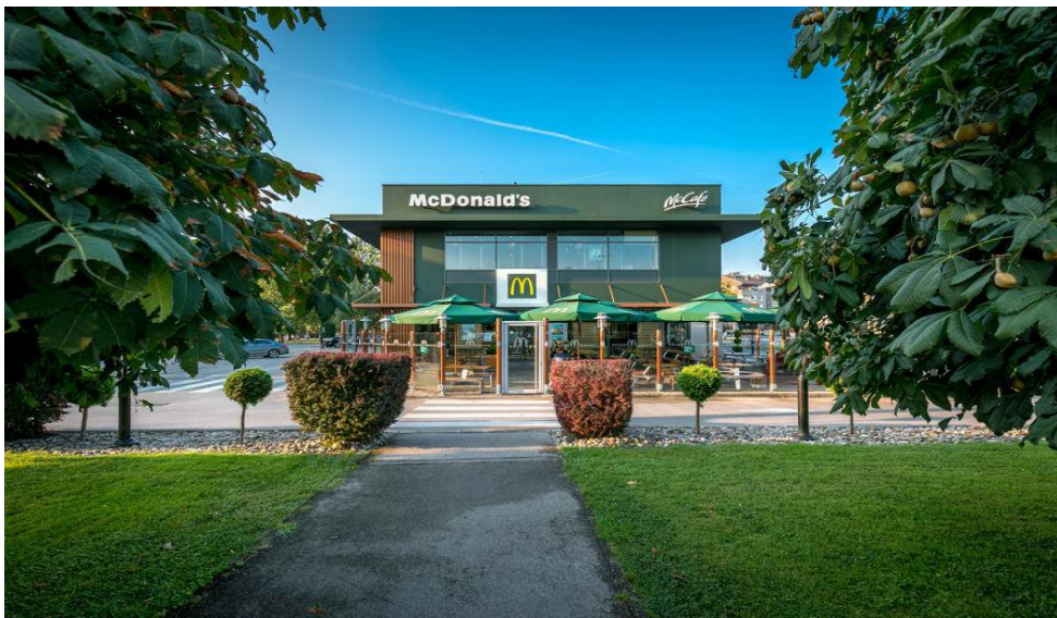
Slika 5. Primjer eksterijera McDonald's restorana

preuzimanje hrane. Na kiosku je moguće i skenirati kupone s popustom koji su dostupni isključivo na McDonald'sovoj mobilnoj aplikaciji. A ako se želi naručiti na kiosku, ali bez kartice, narudžba se može platiti i gotovinom na blagajni. 53 Također nude i opciju drive-in usluge, gdje kupci mogu u svom automobilu naručiti proizvod, te narudžbu preuzeti na šalteru restorana. Pojavio se i digitalni način prodaje, odnosno naručivanje putem njihove McDonald's mobilne aplikacije, UberEats aplikacije, JustEat aplikacije ili PostMates aplikacije u pojedinim zemljama kao što je SAD. Gotovo 50% Amerikanaca nalaze se na udaljenosti manjoj od tri minute od najbližeg McDonald's restorana. Ovo je savršen primjer zašto je baš McDonald's lider u zadovoljstvu kupaca. 54