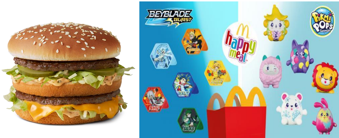
Slika 1. Big Mac i Happy Meal

Međutim, tvrtka postupno proširuje paletu svojih proizvoda, te kupci trenutno mogu kupiti proizvode poput piletine, ribu, proizvode namijenjene vegetarijancima, obroke za doručak itd. 47 Istodobno, McDonald's prilagođava svoj jelovnik, tako McDonald's jelovnik u SAD-u nije jednak kao McDonald's jelovnik u Indiji.