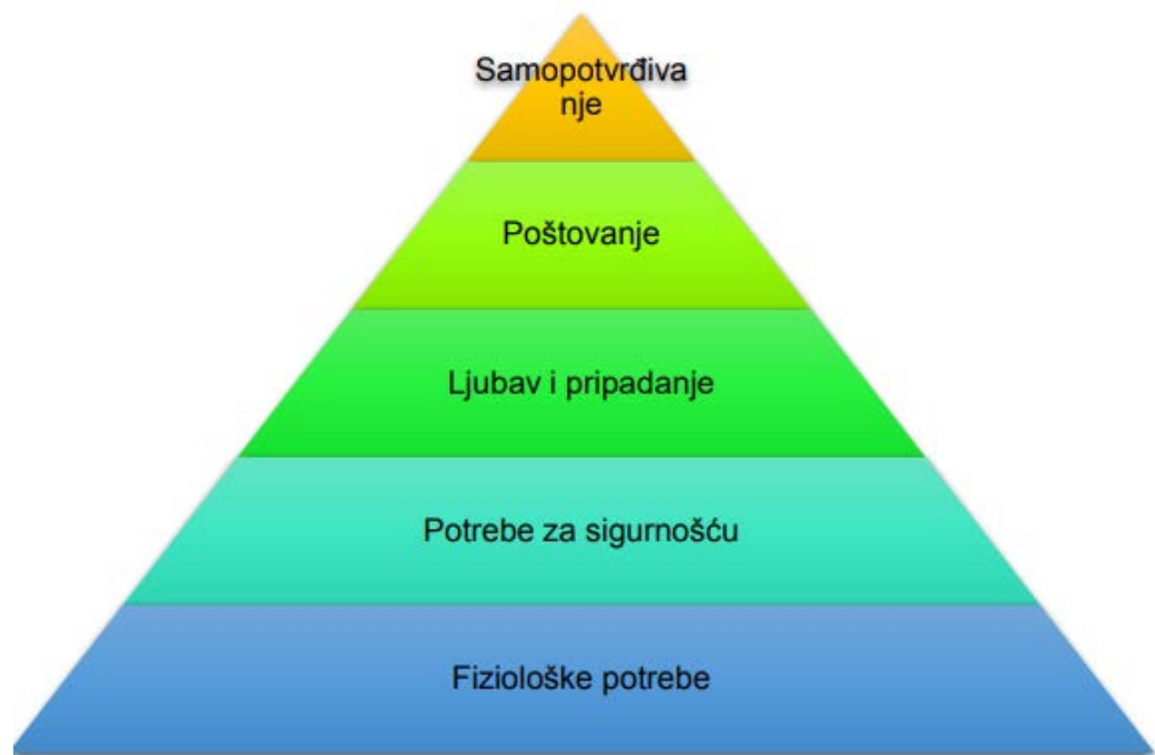
Slika 2 – Maslowljeva hijerarhija potreba

Po njemu, ljudi imaju potrebe nižeg reda kao što su fiziološke potrebe, potrebe za sigurnošću te društvene potrebe i potrebe višeg reda koje uključuju potrebe za poštovanjem te potrebe za samoaktualizacijom. Ova podjela se može bolje objasniti uz pomoć sljedeće slike.