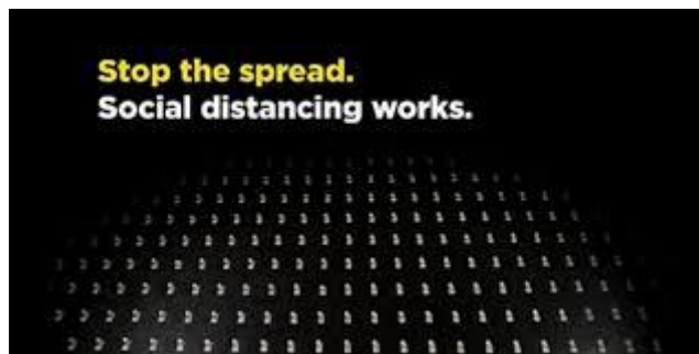
Slika 1: Isječak iz oglasa „ Mouse traps and ping pong balls to show powerful message: Social distancing works“

Izabrani oglas pojavljuje se na društvenim mrežama kao što su Facebook, Youtube i dr.