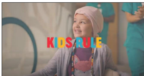
Slika 3: Isječak iz oglasa „Children’s Health / Kids Rule – Party“

Djelatnici bolnice, stečenim iskustvom te dugogodišnjim radom s djecom, nastoje osigurati ugodnu atmosferu u bolnici kako za djecu, tako i za njihove roditelje.