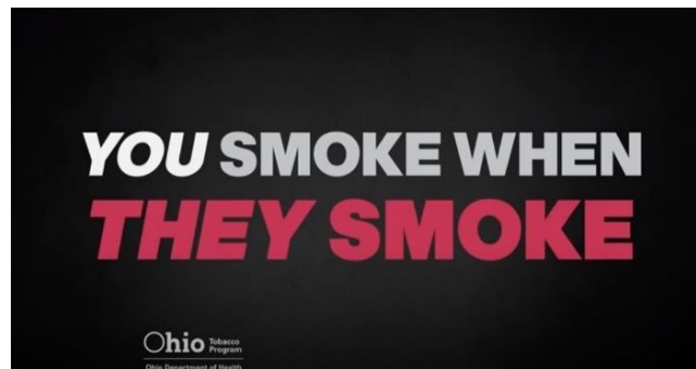
Slika 5: Isječak iz oglasa „You smoke when they smoke“

Kako bi se taj rizik smanjio, Ohio Department of Health (Ministarstvo zdravlja u Ohiju) kreirao je oglas direktno namijenjen pušačima, ali i nepušačima, što danas predstavlja gotovo cijelu populaciju.