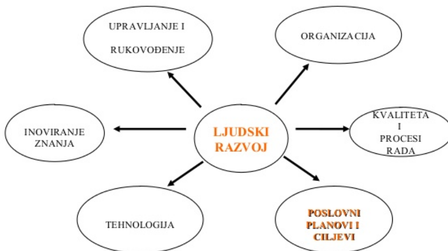
Slika 1.: Utjecaj suvremenih ljudskih resursa

Poanta je da će prilikom procjene u svrhu primjerice nagrađivanja i/ili napredovanja u slučaju tvrdog upravljanja ljudskim resursima biti izabran najbolji radnik, a u slučaju mekog upravljanja ne nužno najbolji radnik u nadi da će se on u (bližoj) budućnosti razviti. Danas je situacija takva da sve više organizacija tvrdo upravlja ljudskim resursima, posebno kad je riječ o privatnicima, dok su javna poduzeća više-manje okrenuta mekom upravljanju. Važno je naglasiti da do nedavno nisu ni postojali odjeli ljudskih potencijala unutar organizacija, već „kadrovska služba“ koja se bavila uglavnom zapošljavanjem i plaćama. Međutim, danas HR odjeli imaju puno više funkcija i igraju znatno veću ulogu nego što je to bio slučaj s kadrovskom službom. 8