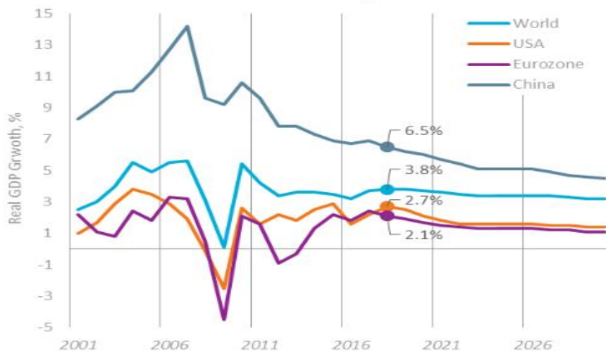
Real GDP Growth in the World's Major Economies: 2001-2030

Source: Euromonitor International's Macro Model Note: Data labels show forecast values for 2018.