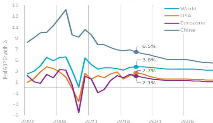
Real GDP Growth in the World's Major Economies: 2001-2030

Source: Euromonitor International's Macro Model Note: Data labels show forecast values for 2018.