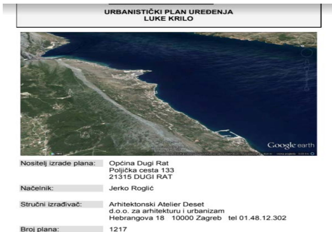
Slika 3.8. Urbanistički plan uređenja luke Krilo