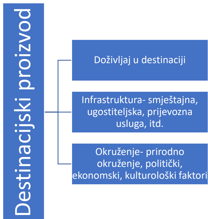
Slika 2.2. Model destinacijskog proizvoda

S obzirom na sve veću konkurenciju te borbu za turiste između destinacija sve češće se nameće pitanje što čini turistima poželjan i kvalitetan destinacijski proizvod 11 . Na sljedećoj slici prikazan je model destinacijskog proizvoda s elementima koji se smatraju bitni za stvaranje doživljaja.