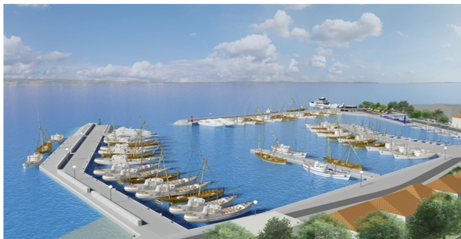
Slika 3.7. Izgled pomorske luke Krilo nakon završetka projekta

Činjenica da će se tik uz hotel graditi moderna luka, čiji će korisnici biti visoke platežne moći, zahtijeva podizanje razine kvalitete smještaja i usluge kako bi takav tip gosta bio zadovoljen. U nastavku prilažem projektne slike pomorske luke koje mi je direktor hotela Marin Cokarić ustupio za korištenje u završnom radu.