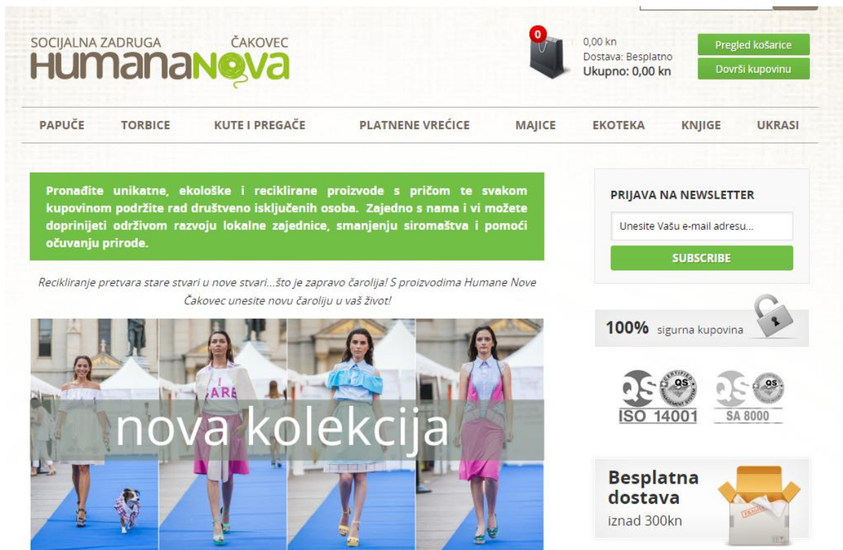
Slika 8: Web shop socijalne zadruge Humana Nova