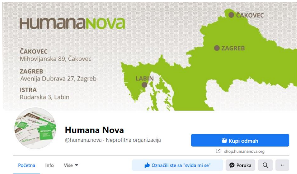
Slika 5: Facebook stranica socijalne zadruge Humana Nova