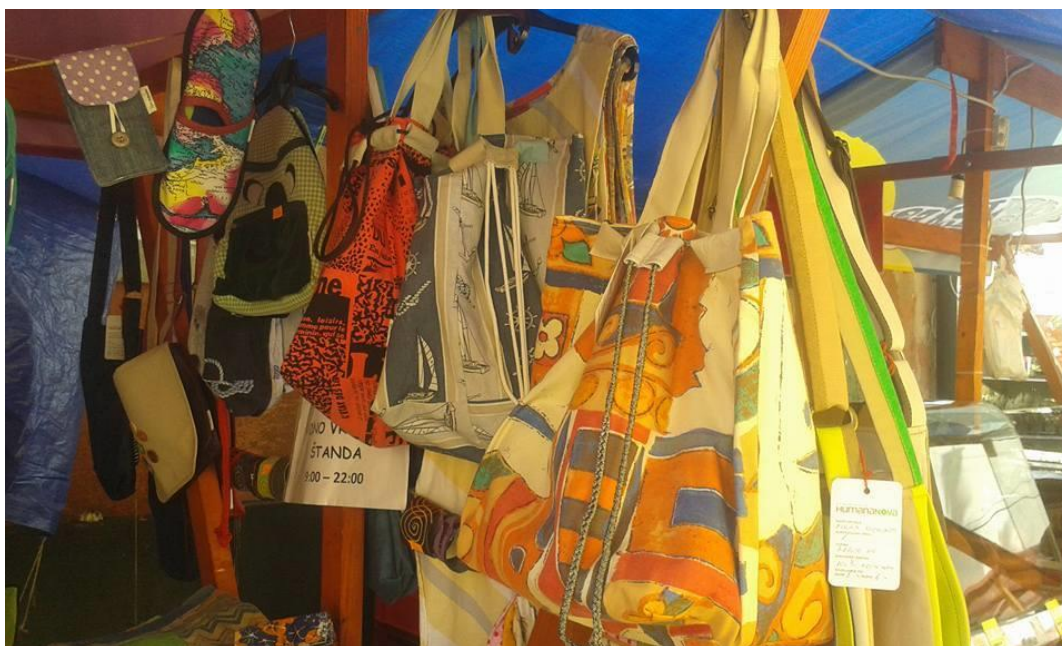
Slika 7: Dio štanda socijalne zadruge Humana Nova