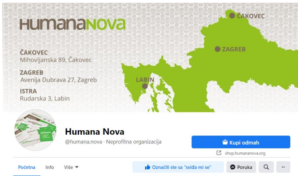
Slika 5: Facebook stranica socijalne zadruge Humana Nova