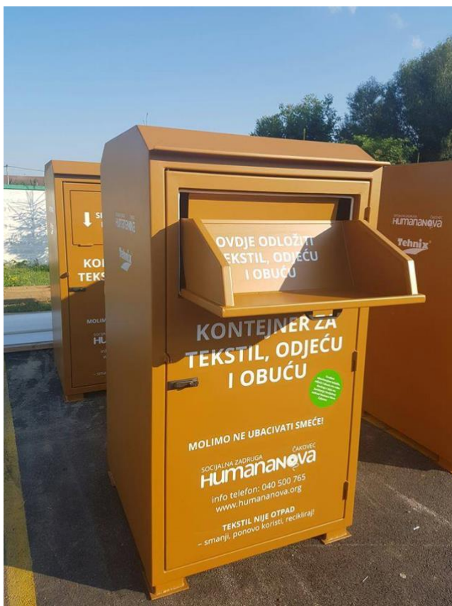
Slika 6: Izgled kontejnera za odlaganje odjeće i obuće