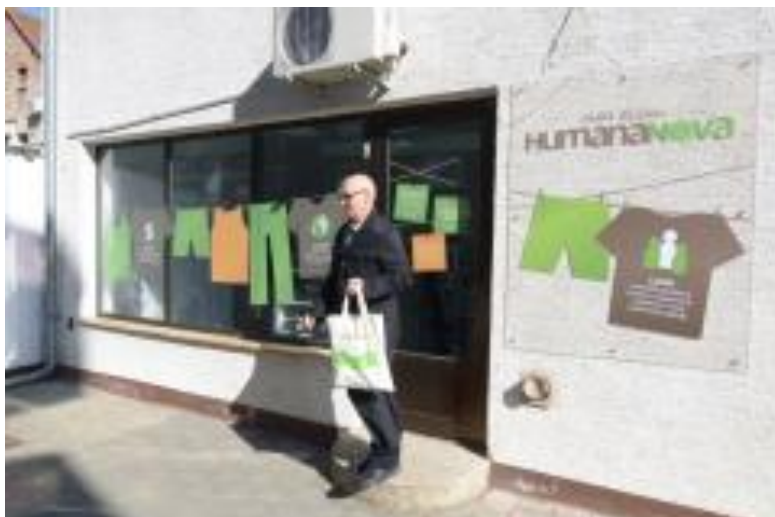
Slika 4: Prva trgovina rabljenom odjećom socijalne zadruge Humana Nova u Čakovcu

Socijalna zadruge Humana Nova Čakovec osnovana je 2011. godine u sklopu projekta ESCO - "edukacija za socijalno zadrugarstvo - nove mogućnosti za osobe s invaliditetom". Primarni cilj ovog projekta je bilo zapošljavanje osoba s invaliditetom u Međimurskoj županiji, odnosno promicanje uključivanja te podizanje razine svijesti o zapošljivosti osoba s invaliditetom kako na lokalnoj, ali i na nacionalnoj razini. Po završetku provedbe projekta, osnovana je socijalna zadruge Humana Nova, koja i danas djeluje. Dodatno, tijekom godina, poslovanje socijalne zadruge se širilo te su zaposlene nove osobe te su također, otvorene poslovnice u Zagrebu, Poreču i Labinu. 48