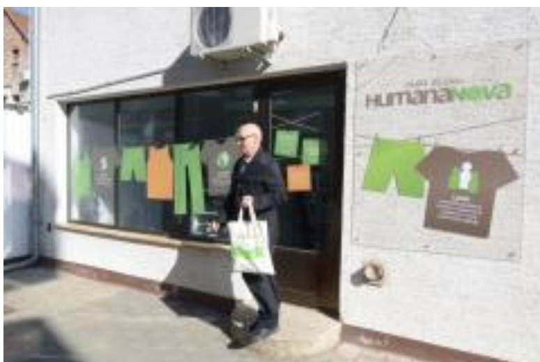
Slika 4: Prva trgovina rabljenom odjećom socijalne zadruge Humana Nova u Čakovcu

Socijalna zadruge Humana Nova Čakovec osnovana je 2011. godine u sklopu projekta ESCO - "edukacija za socijalno zadrugarstvo - nove mogućnosti za osobe s invaliditetom". Primarni cilj ovog projekta je bilo zapošljavanje osoba s invaliditetom u Međimurskoj županiji, odnosno promicanje uključivanja te podizanje razine svijesti o zapošljivosti osoba s invaliditetom kako na lokalnoj, ali i na nacionalnoj razini. Po završetku provedbe projekta, osnovana je socijalna zadruge Humana Nova, koja i danas djeluje. Dodatno, tijekom godina, poslovanje socijalne zadruge se širilo te su zaposlene nove osobe te su također, otvorene poslovnice u Zagrebu, Poreču i Labinu. 48