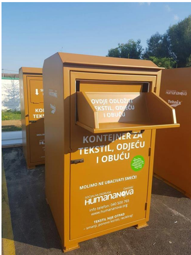
Slika 6: Izgled kontejnera za odlaganje odjeće i obuće