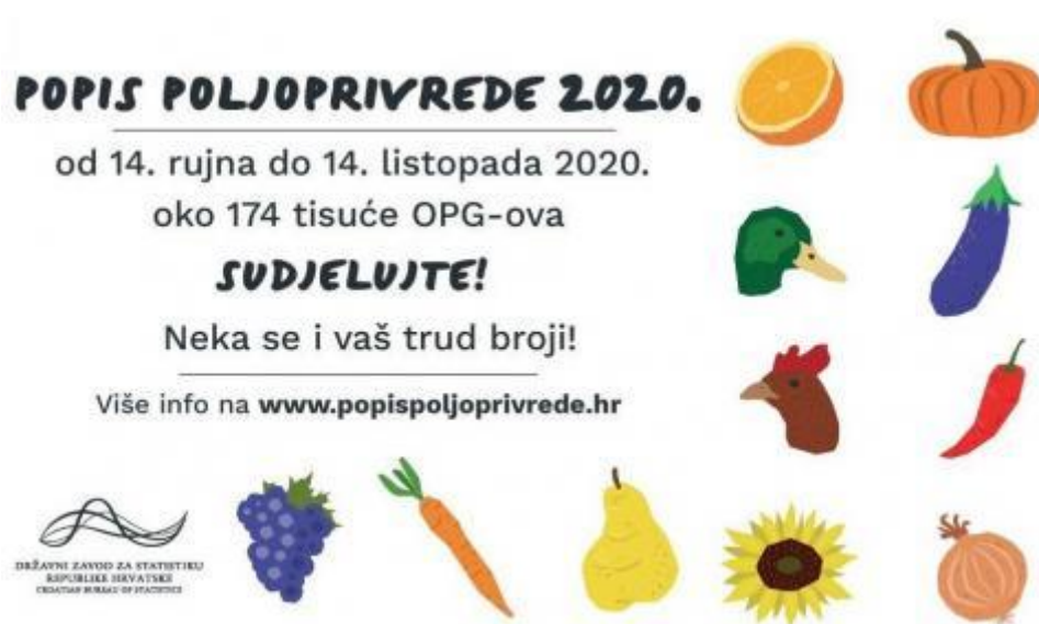
Slika 7: Poziv za popis poljoprivrede 2020.

Prikupljeni podaci o strukturi poljoprivrednih gospodarstava bit će usporedivi na razini Europske unije i pružit će potrebnu statističku bazu za planiranje, provedbu, nadzor, procjenu i reviziju povezanih politika, osobito Zajedničke poljoprivredne politike (ZPP-a), uključujući mjere ruralnog razvoja, okolišne politike, politike za prilagodbu klimatskim promjenama i njihovo ublažavanje, korištenja zemljišta i neke ciljeve održivog razvoja. 35