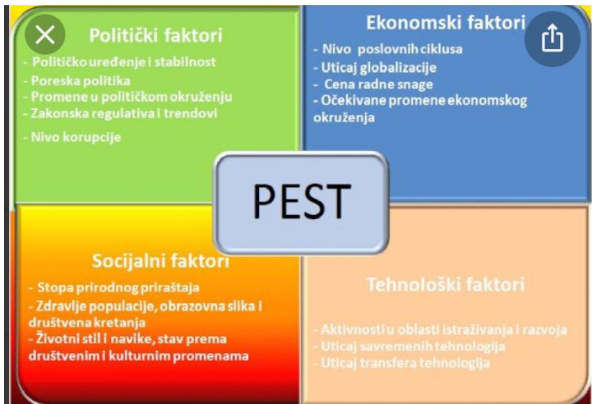
Slika 4. Shema provedbe PEST analize