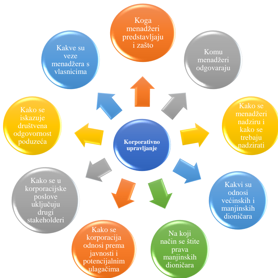
Slika 1. Područja korporativnog upravljanja