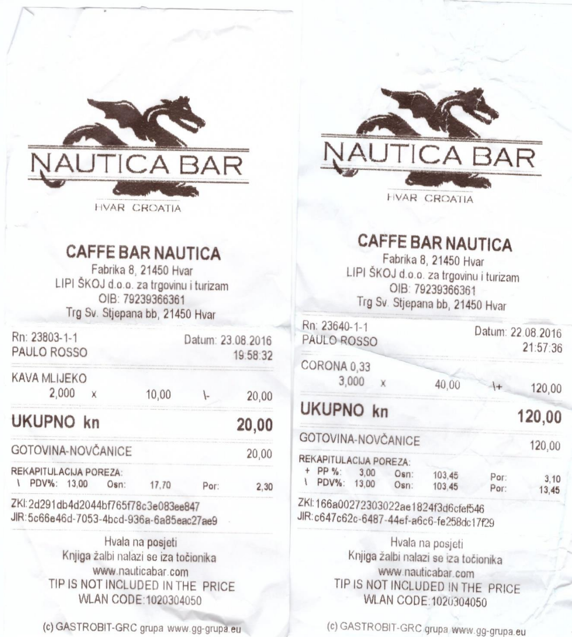
Slika 3: izlazni računi

Kod ugostiteljstva se obračunava porez na potrošnju i PDV po različitim poreznim stopama. U sljedećim primjerima ćemo pokazati koji artikli podliježu porezu na potrošnju i po kojoj poreznoj stopi.