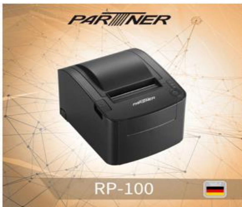
Slika 6: Termalni pisač PartnerTech RP-100