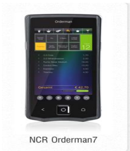
Slika 2: NCR Orderman 7

U svojoj ponudi Remaris također ima i NCR Orderman 7 koji ima jednake karakteristike kao i onaj koji nudi Gastrobit GRC grupa, ali je priključen na Remaris programe za ugostitelje. 27