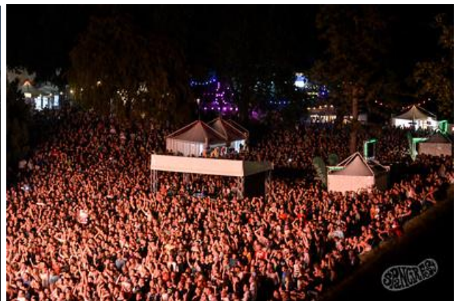
Slika 8: Ulični zabavljači na Špancirfestu