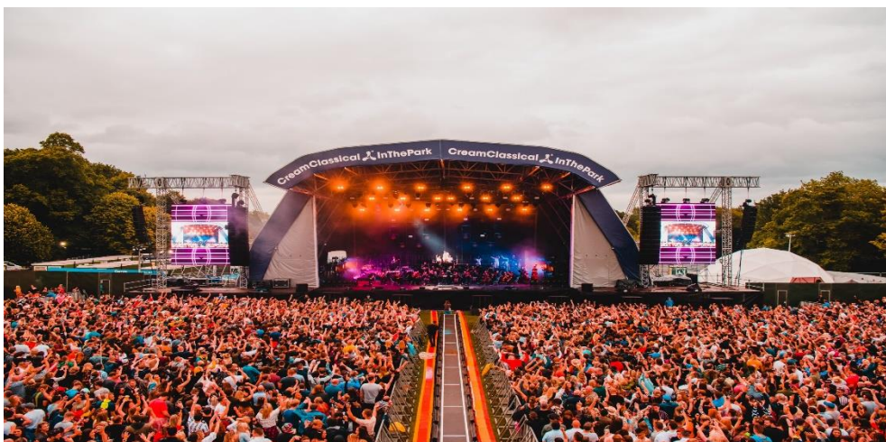
Slika 12: Creamfields festival, Velika Britanija