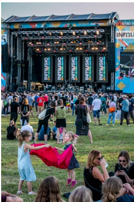
Slika 2: IN music festival, 2019.godina