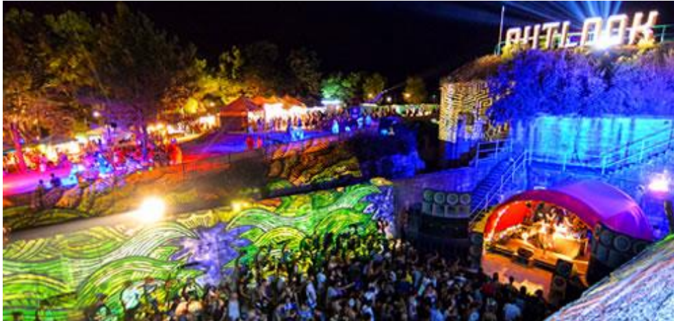
Slika 5: Outlook festival, 2018. godina

koristi, proporcionalno raste turistička potrošnja u destinaciji, imidž same destinacije ali i negativni okolišni utjecaji festivala prikazani u prethodnim poglavljima.