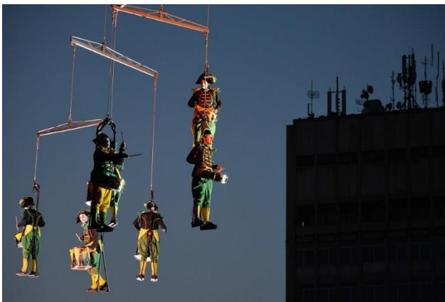
Slika 7: Akrobati na Špancirfestu

Festival se održava u samom centru Varaždina, no ne postoje nikakve precizne na upute na službenoj stranici festivala kako doći do grada. Zemljovid Hrvatske s označenim gradom Varaždinom bio bi praktičan, no nije prikazan. Posjetitelj je primoran poslužiti se internetskim stranicama i pronaći upute. Za bilo kakve dodatne informacije, potencijalni posjetitelji slobodni su obratiti se putem e-pošte. Dapače, prostor za poruku već je napravljen na službenoj stranici i potrebno je samo unijeti ime i prezime i napisati poruku na predviđeno mjesto.