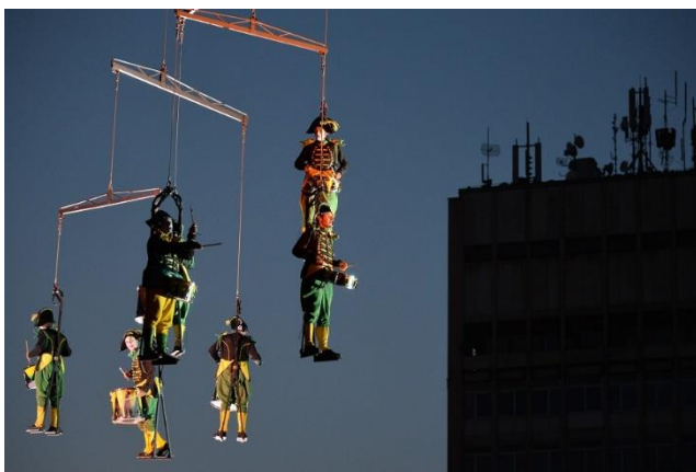
Slika 7: Akrobati na Špancirfestu

Festival se održava u samom centru Varaždina, no ne postoje nikakve precizne na upute na službenoj stranici festivala kako doći do grada. Zemljovid Hrvatske s označenim gradom Varaždinom bio bi praktičan, no nije prikazan. Posjetitelj je primoran poslužiti se internetskim stranicama i pronaći upute. Za bilo kakve dodatne informacije, potencijalni posjetitelji slobodni su obratiti se putem e-pošte. Dapače, prostor za poruku već je napravljen na službenoj stranici i potrebno je samo unijeti ime i prezime i napisati poruku na predviđeno mjesto.