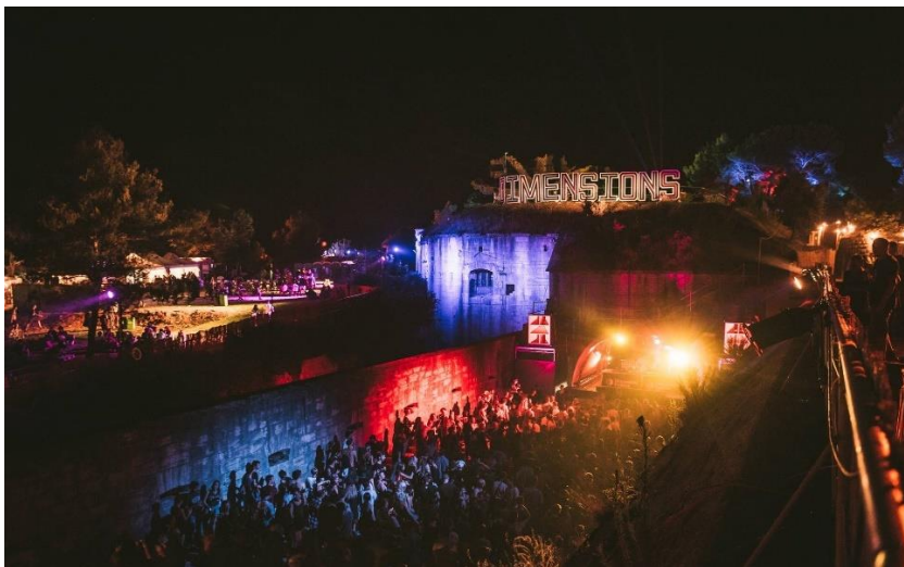
Slika 6: Dimensions festival, 2019. godina