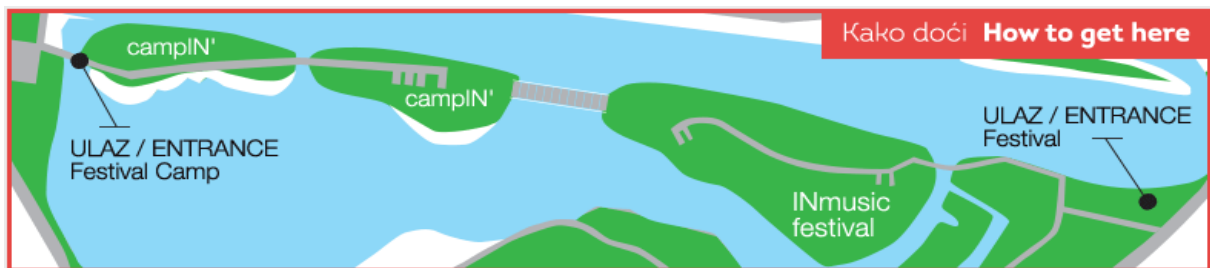
Slika 1: Ilustracija lokacije INmusic festivala

festival. Jedan od izleta u organizaciji INmusic festivala jest „Mrežnica kajaking“ u iznosu od 450 kn pri čemu je osigurana oprema što uključuje transfer, osiguranje, vodiča, kacigu, prsluk, veslo, odijelo i kišnu jaknu u slučaju hladnog vremena. U sklopu izleta izdvajaju se zabavne aktivnosti poput plivanja, veslanja i skakanja sa slapova, minimalni broj prijavljenih je 6, a polazak je sa recepcije kampa festivala. Drugi izlet su „Plitvička jezera“ po iznosu od 730 kn, a izlet uključuje transfer, osiguranje, vodiča, ulaznice za nacionalni park i vožnju brodom. Predviđene aktivnosti su planinarenje, vožnja brodom i vožnja panoramskim vlakom. Minimalni broj prijavljenih izletnika je 6, a polazak je sa recepcije kampa festivala. Oba izleta detaljno su objašnjena na službenoj stranici festivala, a prijave i sve dodatne informacije vrše se putem e-pošte.