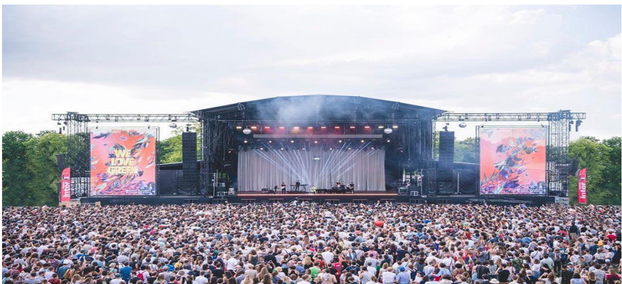
Slika 10: Festival We Love Green, Francuska

Ulaznice festivala moguće je kupiti po cijeni od 750 kuna preko stranice festivala. Cijena uključuje samo pristup festivala. Smještaj bilo kakve vrste nije moguće pronaći preko službene stranice festivala. Uz ulaznice, festival na svojim stranicama daje mogućnost kupnje majica, kapuljača, torbi, čaša i sličnih proizvoda sa logom festivala. Cijene se kreću od 70 kn do 250 kn, ovisno o proizvodu. Oglašeni su putem društvenih mreža YouTube, Instagram, Facebook i Twitter, te preko svoje službene stranice. Brojne institucije surađuju i podržavaju ih, imaju bezbroj medija za partnere i 3 sponzora. Druge informacije nisu navedene na službenoj stranici festivala, osim navedenih. Svakako, stoje na raspolaganju putem e-pošte za dodatna pitanja i informacije.