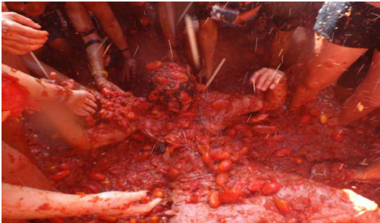
Slika 11: Festival La Tomatina, Španjolska

Iako festival organizira dolazaka na lokaciju, precizne upute za dolazak u Buñol su prikazane na službenoj stranici festivala za one koji samostalno planiraju doći. Navedene informacije u tekstu jedini su podaci koje posjetitelji mogu pronaći na službenoj stranici festivala.