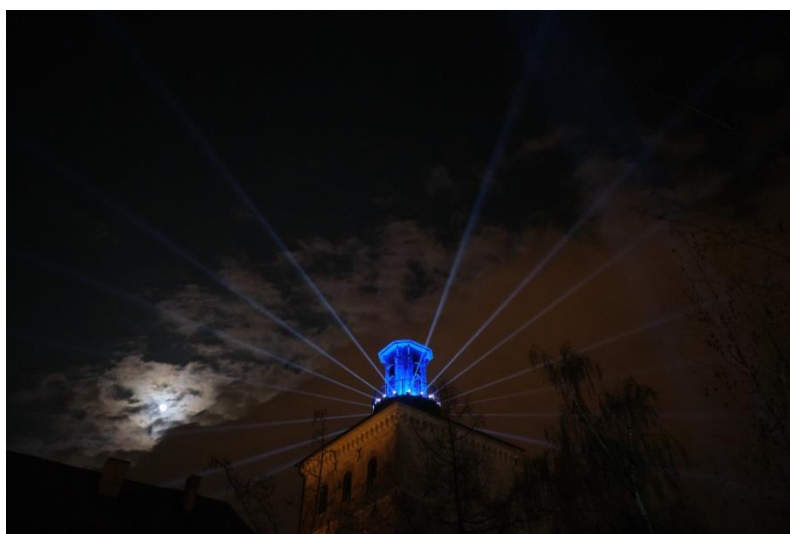
Slika 4: Festival svjetla, 2019. godina

Na službenoj stranici festivala nisu jasno označene lokacije koje obasjava svjetlo na dane održavanja, a za sve potrebne informacije moguće je obratiti se turističkom informativnom centru grada Zagreba putem e-pošte.