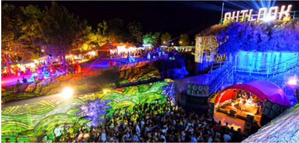
Slika 5: Outlook festival, 2018. godina

koristi, proporcionalno raste turistička potrošnja u destinaciji, imidž same destinacije ali i negativni okolišni utjecaji festivala prikazani u prethodnim poglavljima.