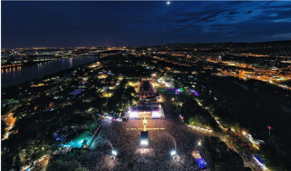
Slika 9: Sziget festival na otoku Obudai, Mađarska

Za sve one koji su kupili ulaznicu za festival ili planiraju to učiniti, postoji mogućnost prijave imenom, prezimenom i e-poštom kako bi se svakodnevno primale sve novosti i informacije u svezi s festivalom. Osim navedenih informacija u poglavlju, druge korisne informacije nisu izravno prikazane za potencijalne posjetitelje.