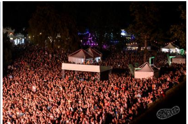
Slika 8: Ulični zabavljači na Špancirfestu