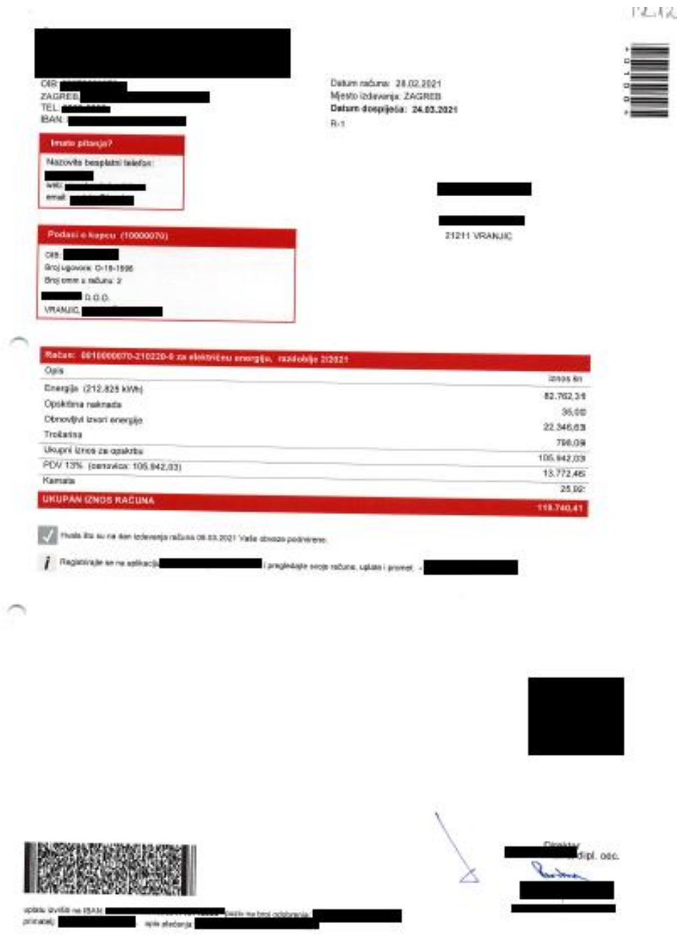
Slika 3. Primjer ulaznog računa – trošak električne energije

Poduzeće je 28.02.2021. dobilo račun HEP-a za električnu energiju.