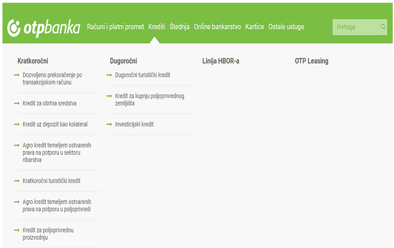
Slika 3. – Ponuda kredita unutar OTP banke