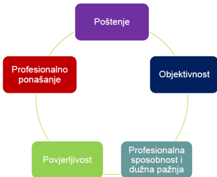
Slika 3: Načela etike

Potaknut načelom profesionalnog ponašanja revizor će se ponašati skladu s mjerodavnim zakonima i regulativama te će nastojati izbjeći radnje koje diskreditiraju profesiju. Isključivo potpuno neovisni reizor može dosljedno primjeniti temeljna revizijska načela etike.