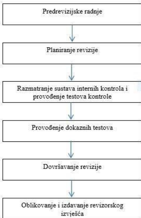
Slika 1: Faze revizijskih aktivnosti