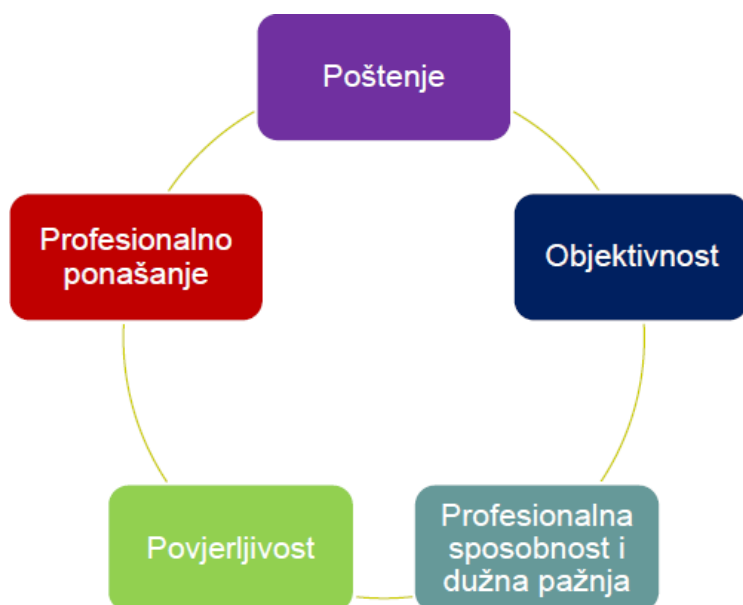
Slika 3: Načela etike

Potaknut načelom profesionalnog ponašanja revizor će se ponašati skladu s mjerodavnim zakonima i regulativama te će nastojati izbjeći radnje koje diskreditiraju profesiju. Isključivo potpuno neovisni reizor može dosljedno primjeniti temeljna revizijska načela etike.