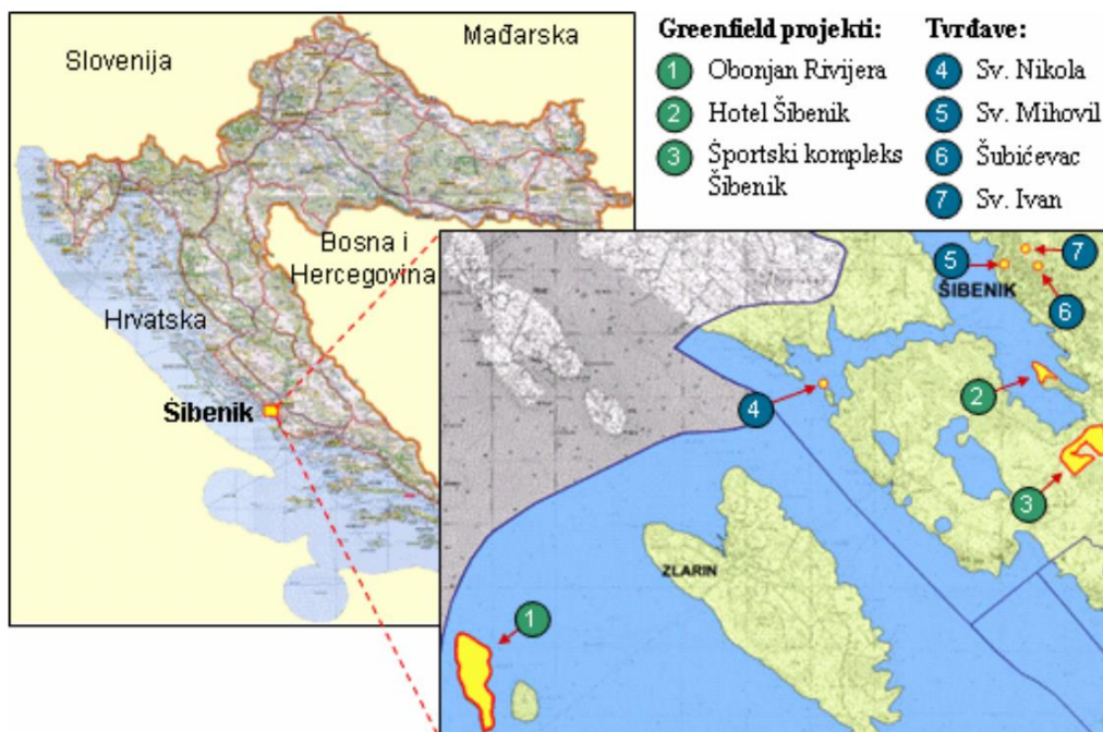
Slika 3: Prikaz položaja projekata Grada Šibenika