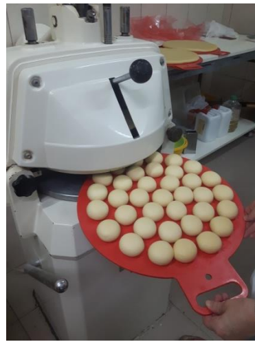
Slika 5. Stroj za virkanje

Stroj za virkanje krafni ima posebne kalupe na koje se stavlja tijesto. Kalup se umetne u stroj i zatvori sa ručkom koja se nalazi sa lijeve strane. Kad se stroj zatvorio onda se stisne ručka koja se nalazi na sredini gornjeg dijela i drži je se stisnutom desetak sekundi. Kad se stroj otvori tijesto je razvaljano u kuglice tj. oblik za pečenje krafni.