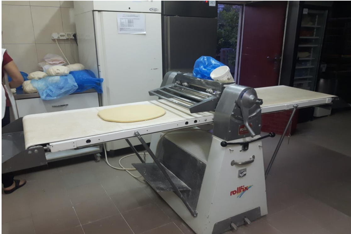
Slika 4. Stroj za razvlačenje tijesta

Na pokretnu traku se stavlja tijesto. Stroj za razvlačenje ima dvije papučice, lijeva papučica pomiče traku u lijevo, dok desna pomiče u desno. Iznad papučica se nalazi ručica na kojoj su naznačeni centimetri. Pomicanjem te ručice reguliramo debljinu tijesta, tj. određujemo na koju debljinu želimo tijesto razvaljati.