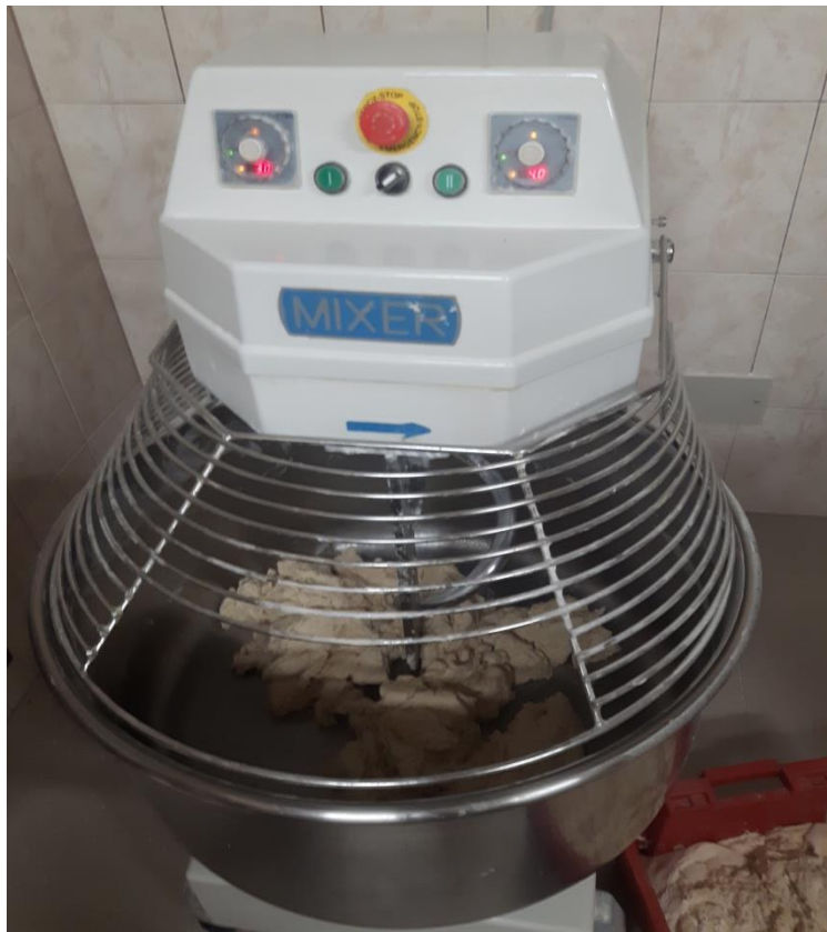
Slika 3. Stroj za miješanje tijesta

U stroj se ubacuju svi potrebni sastojci za izradu tijesta- brašno, voda, sol, ulje, kvasac. Stroj miješa sve sastojke otprilike pola sata dok se oni ne sjedine u jednu smjesu.