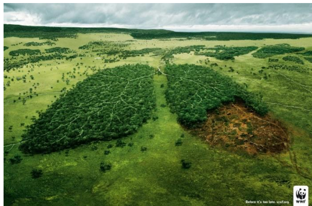
Slika 2: Primjer korištenja emocija u marketingu

Jedan od internih faktora, izuzetno važan za poduzeća, su emocije . Emocije su toliko važne da je se čak razvila posebna grana koja se zove emocionalni marketing. Marketinški stručnjaci koriste emocije kako bi potrošače naveli na određeno ponašanje. Jedan od boljih primjera predstavlja nova marketinška kampanja Svjetskog fonda za divljinu ( eng. skr. WWF ). Kampanja se zove „Prije nego li je prekasno“, a koristeći sliku koja prikazuje drveća u obliku pluća (Slika 2), Fond poziva na smanjivanje deforestacije odnosno prevelikog uklanjanja šuma radi poduzimanja drugih aktivnosti na tom zemljištu.