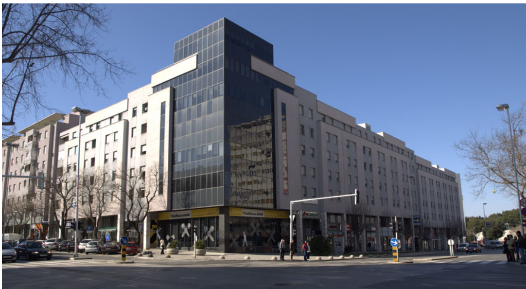
Slika 5: Stambeno – poslovna zgrada Sukoišan 1

Ostale strategije unaprjeđenja svode se na poboljšanje proizvoda koji je generički ili nema patentnih prava. Tvrtka Ora - mont se odlučila za strategiju prestižnog proizvoda i to kao modifikator a ne kao imitator ili kopirant. Njihova strategija se zasnivala da ponudi objekte slične kao Dalkoning ili Elanija ali na prestižnim lokacijama uz zaračunavanje više cijene.