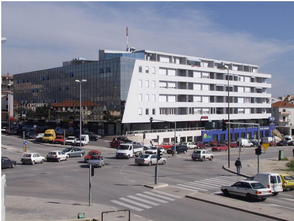
Slika 3: Stambeno – poslovna zgrada Belvedere u Splitu

Na ovaj način poslovnim kupcima i unajmiteljima poslovnih prostora dugoročno je osigurana klijentela i održivost na tržištu. Objekt je postao ekonomski samoodrživ što je dodatno koristilo percepciji Dalkoninga kao tržišnog lidera.