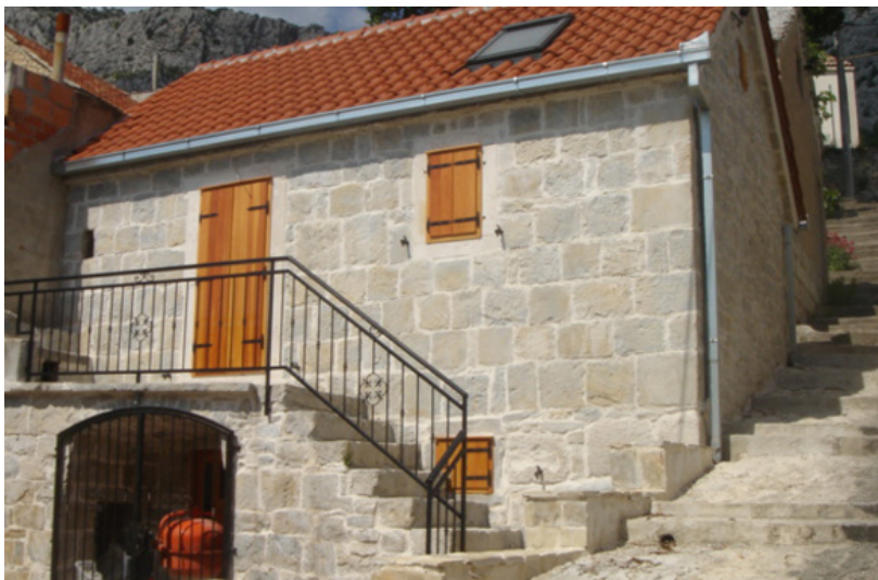
Slika 6: Kamena kuća Brela

Tamponeri se u pogledu promocije oslanjaju na ciljano oglašavanje, specijalizirane TV emisije i programe i osobne kontakte. Njihove strategije su otpornije na tržišne trendove ali su ranjive u smislu ulaska konkurencije drugih tamponera.