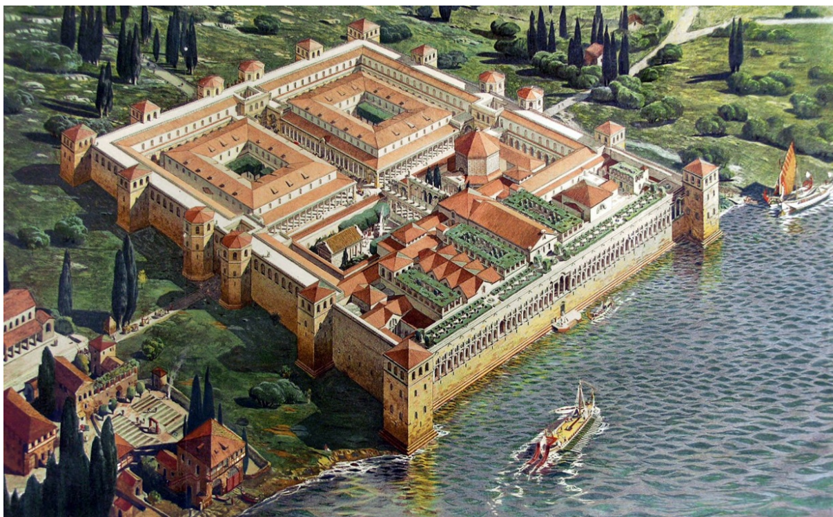
Slika 2: Dioklecijanova palača