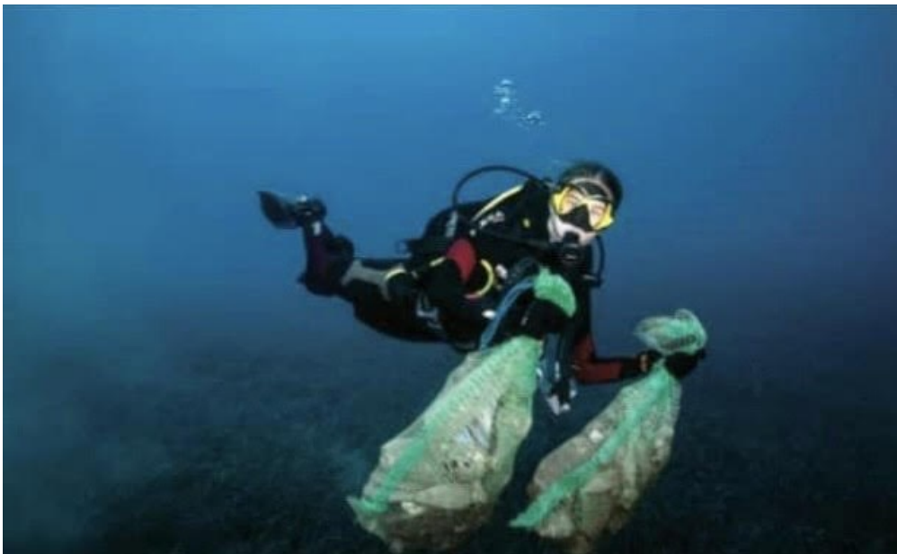
Slika 5 – Primjer čišćenja podmorja

održava radionicu čišćenja podmorja što značajno doprinosi održivom razvoju i zaštiti okoliša.