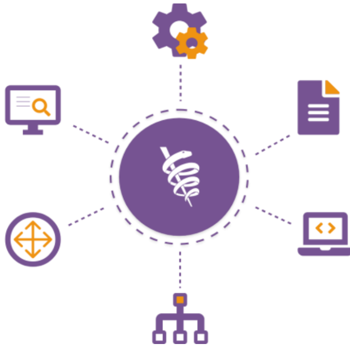
Slika 4. Current Procedural Terminology

Izvor: AMA, https://www.ama-assn.org/amaone/cpt-current-procedural-terminology (pristup: 22.06.2022.)