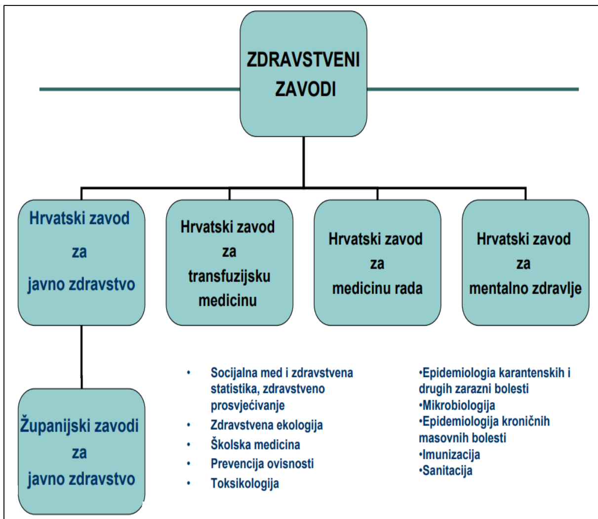
Slika 2. Zdravstveni zavodi u Republici Hrvatskoj