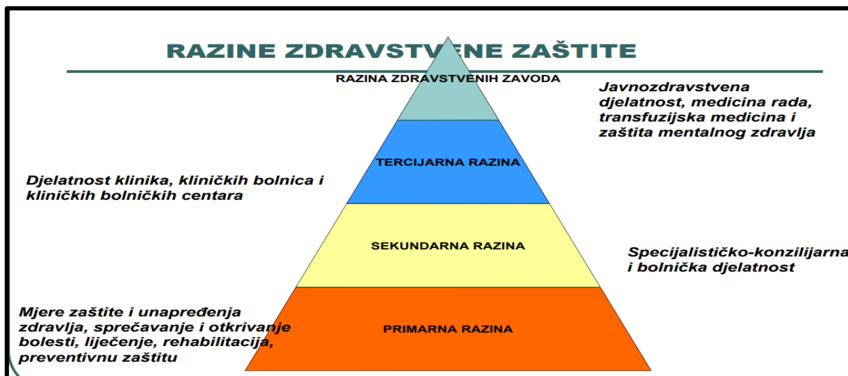
Slika 1. Razine zdravstvene zaštite