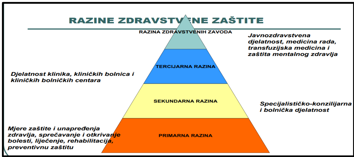
Slika 1. Razine zdravstvene zaštite