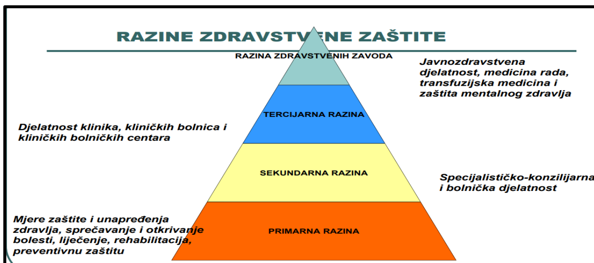
Slika 1. Razine zdravstvene zaštite