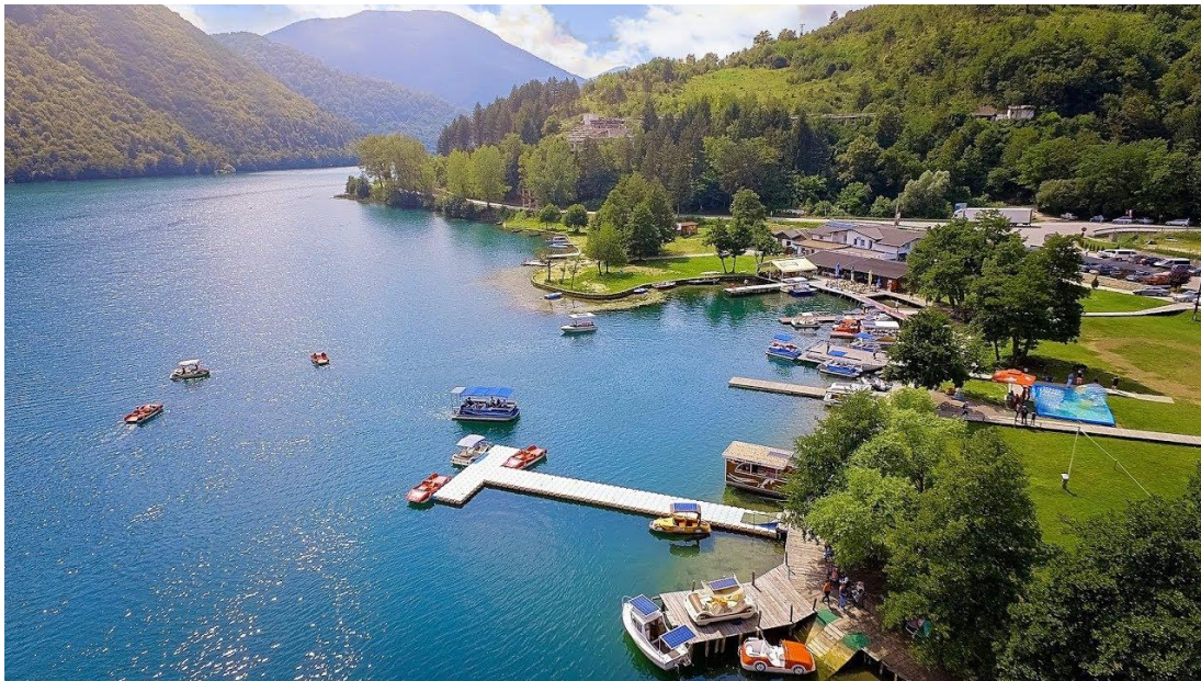
Slika 4. Hotel Plivsko jezero, Jajce

Na području Županije se nalazi veći broj objekata privatnog smještaja, kao što su vikendice i kuće za iznajmljivanje. Hoteli nisu zastupljeni u velikom broju, ali se Hotel Plivsko jezero može izdvojiti kao posebno mjesto za odmor i rekreaciju pojedinaca i obitelji. Zavidne lokacije, nalazi se uz samu obalu Plivskog jezera, udaljen 4 kilometra od centra grada Jajca. Hotel sadrži potpuno renovirane moderne sobe i apartmane koji će zadovoljiti potrebe gostiju koji traže odmor i relaksaciju. S druge strane, za ljubitelje raznih aktivnosti, Hotel pruža usluge iznajmljivanja plovila idealnih za istraživanje jezera i posebnih životinjskih vrsta, zatim najam vožnje tandem biciklima koji su jedinstven način obiteljske zabave te dječji park za najmlađe posjetitelje.