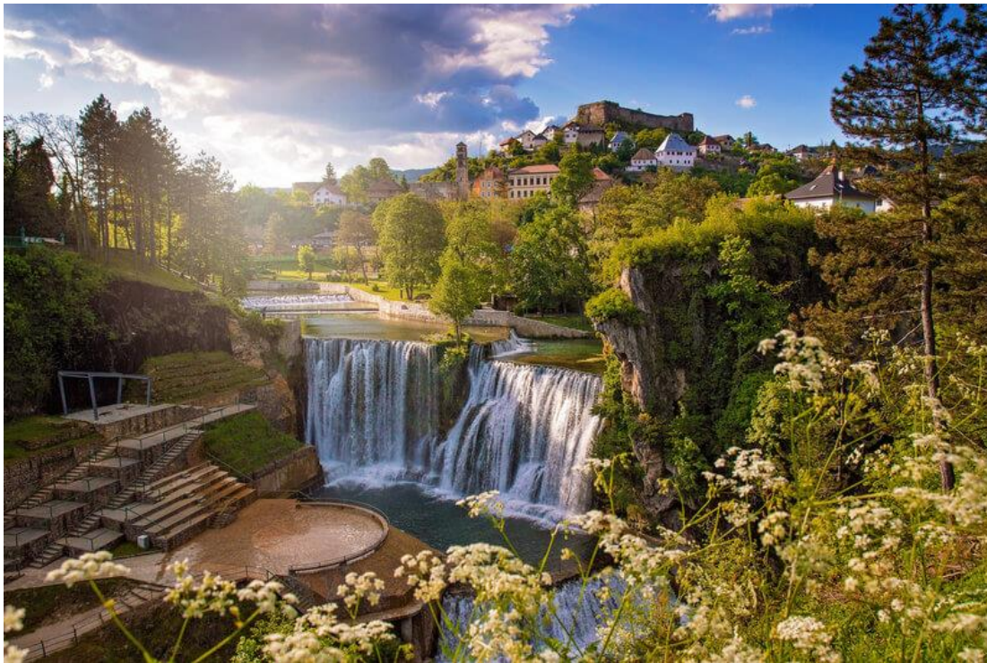
Slika 2. Plivski vodopad

svake godine okuplja desetak tisuća hodočasnika iz cijele Europe, franjevački samostan iz 19. stoljeća u kojemu se čuvaju kosti posljednjeg bosanskog kralja Stjepana Tomaševića te džamija Esme-sultanije koja je posljednja građevina izgrađena pod kupolom na teritoriji Bosne i Hercegovine. Važno je spomenuti i Etno muzej Jajce, koji svjedoči o tradiciji i običajima života ovog kraja, a pored zbirke prirodnih bogatstava, u muzeju su prisutne radionice tkanja i veza. Muzej Drugog zasjedanja AVNOJ-a posjeduje zavidan broj knjiga i časopisa kojima se nastoji očuvati sjećanje na antifašističku borbu na prostoru bivše Jugoslavije.