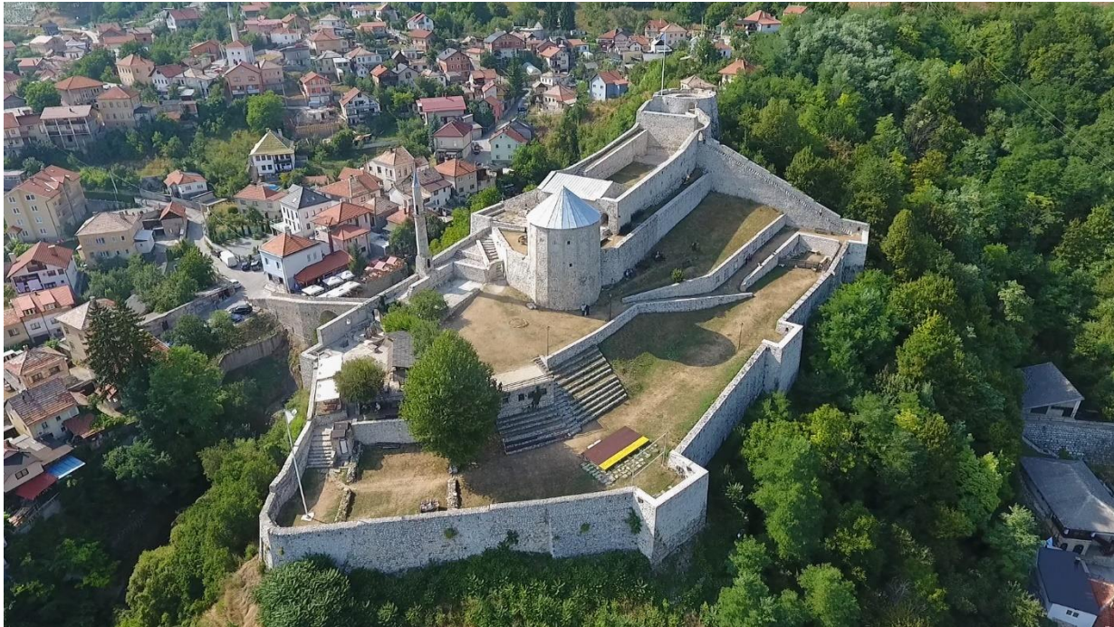
Slika 3. Stari grad u Travniku (Travnička tvrđava)

razdoblja Austrougarske monarhije, mjesto manifestacije „Kajganijada“ kojom se slavi prvi dan proljeća, mjesto autentične gastronomske ponude „Travničkih ćevapa“, mjesto tradicijske proizvodnje Travničkog/Vlašičkog sira, mjesto odgajivačnice pastirskog psa Tornjaka, te mjesto boravka autohtonog kratkokljunog travničkog goluba. 17