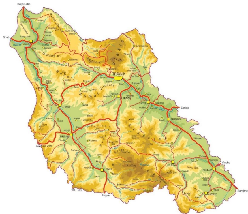
Slika 1. Karta Županije Središnja Bosna