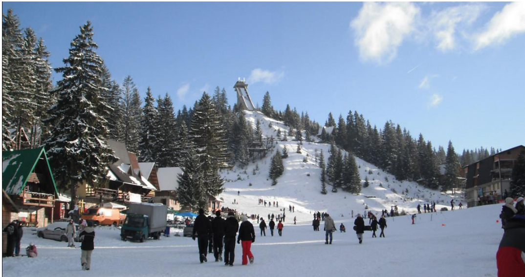
Slika 5. Ski centar Vlašić

Najvažniji oblik turizma za razvoj turističkog sektora Županije Središnja Bosna, ali i Bosne i Hercegovine, zasigurno je planinski turizam. Ski centar Vlašić se nalazi na 28 kilometara udaljenosti od Travnika, sadrži ukupno 15 kilometara skijaških staza srednje teške i lagane kategorije. Vlašić je jedan od poznatijih ski centara u Bosni i Hercegovini, posjeduje sadržajnu vanpansionsku ponudu te veliki broj smještajnih kapaciteta od kojih je oko 800 ležaja u hotelskom smještaju i oko 11 000 ležaja u privatnom smještaju – vikendicama. Skijalište nudi i najam skijaške opreme te školu skijanja. Pored ski centra na Vlašiću, izdvajaju se i sportsko-rekreacijski centar Rostovo u općini Bugojno, ski centar Ranča u općini Jajce, sportsko-rekreacijski centar Raduša u Gornjem Vakufu-USKoplju, skijaški centar Brusnica u blizini Fojnice, ski centar Pridolci u Busovači te Busovačka planina.