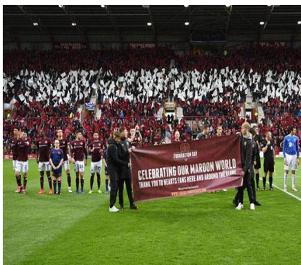
Slika 9: Ceremonija predstavljanja zaklade

Zaklada „The Foundation of Hearts“ je neprofitna organizacija koju je 2010. osnovala grupa lokalnih poslovnih ljudi, od kojih su svi dugogodišnji navijači kluba. Razlog osnivanja zaklade je zajednička i strastvena vizija za budućnost koja se temelji na vraćanju kluba ljudima koji ga vole i koji su zaslužni što je on onakav kakav je sad. Žele ga vratiti navijačima. Zakladi su se 2013. godine priključile sve podgrupe navijača (udruga dioničara, HYDC, Save our Hearts...). Potporu zakladi su pružili brojni političari, od lokalnih do onih u parlamentu sve u cilju unaprjeđenja vizije stjecanja vlasništva kluba.